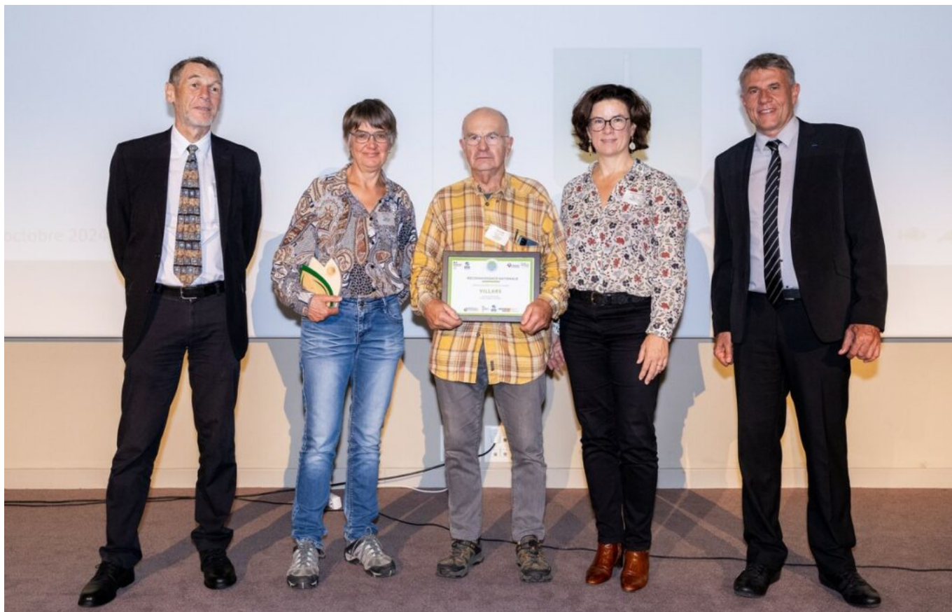
La commune de Villars devient un 'Territoires engagés pour la nature'.

commission extra-municipale ainsi qu'installer des nichoirs pour oiseaux et chauve-souris. De son côté, Villars a séduit par sa volonté de sensibiliser les élus aux enjeux de préservation de la biodiversité par l'organisation de visites et de formations, de communiquer sur la richesse et la fragilité de la forêt communale par la pose de panneaux d'information, d'intégrer la réflexion de l'intensité lumineuse pour préserver la faune dans le projet de remplacement des luminaires de la commune ainsi que de réaliser un inventaire de la biodiversité communale.