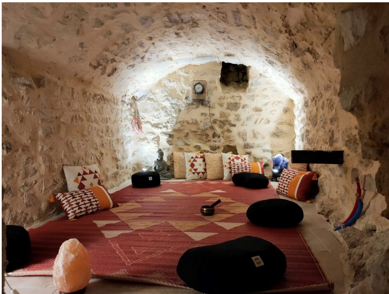
Espace bien-être, véritable havre de paix.