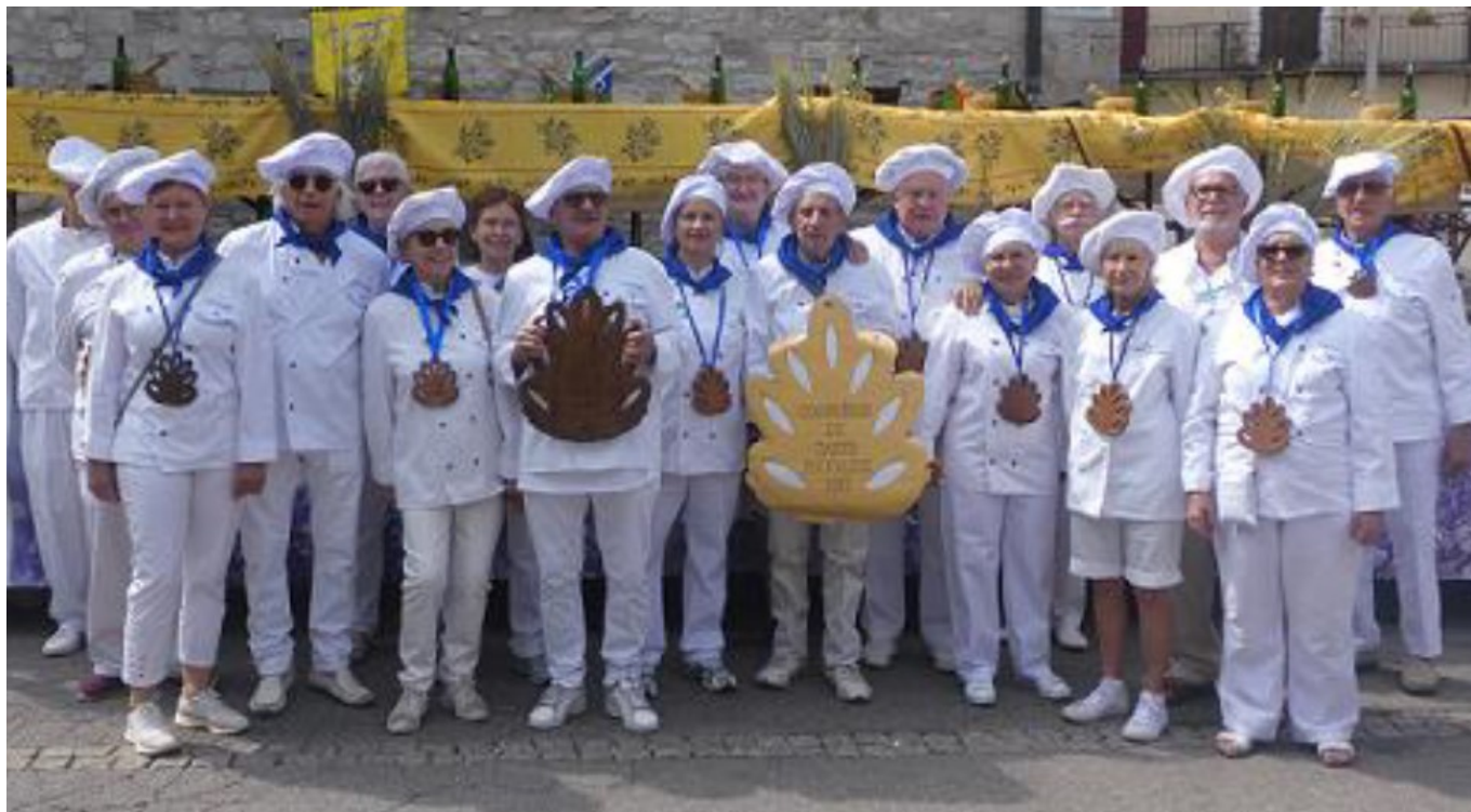
La confrérie du Taste Fougasse