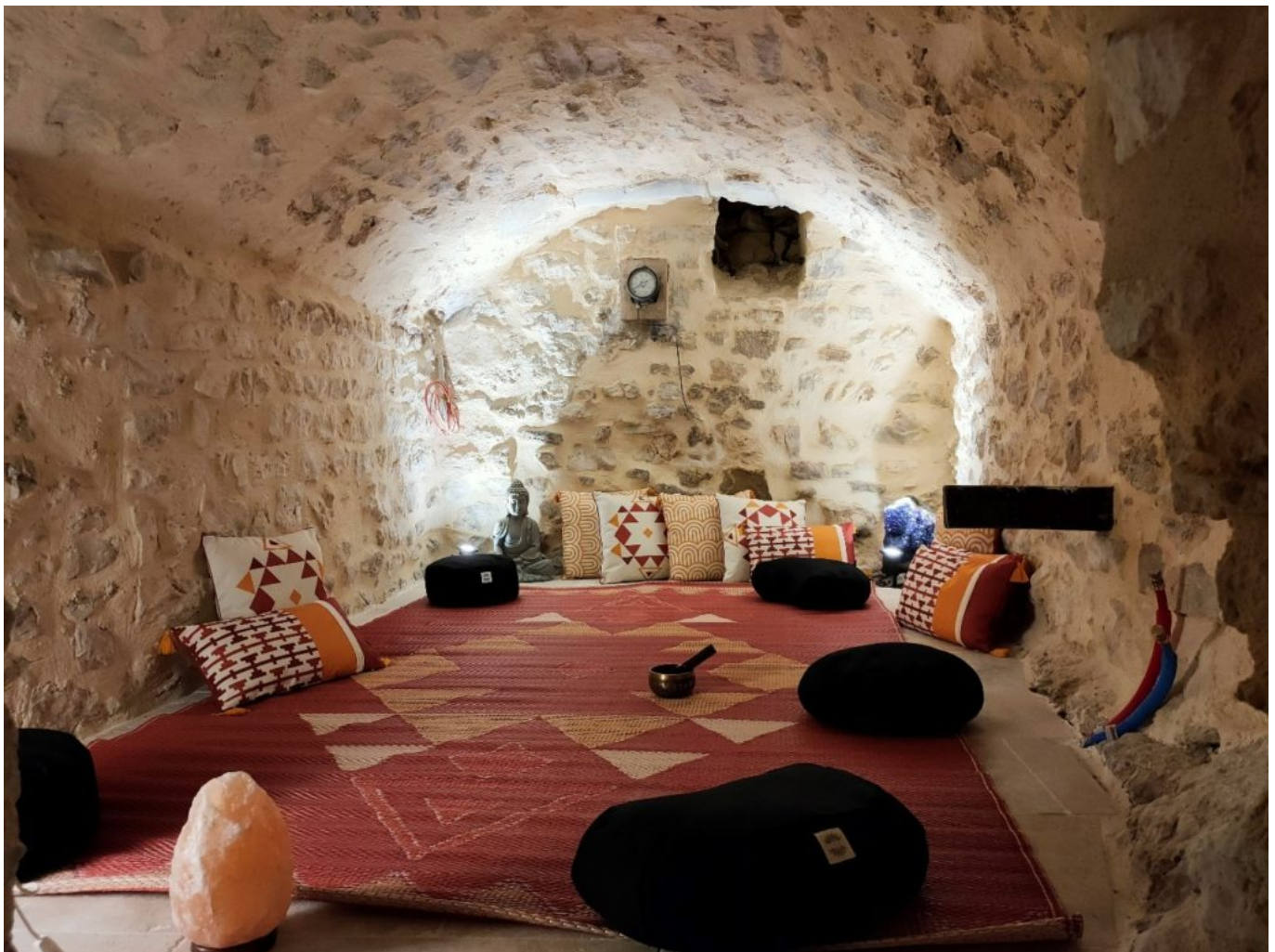
Espace bien-être, véritable havre de paix.