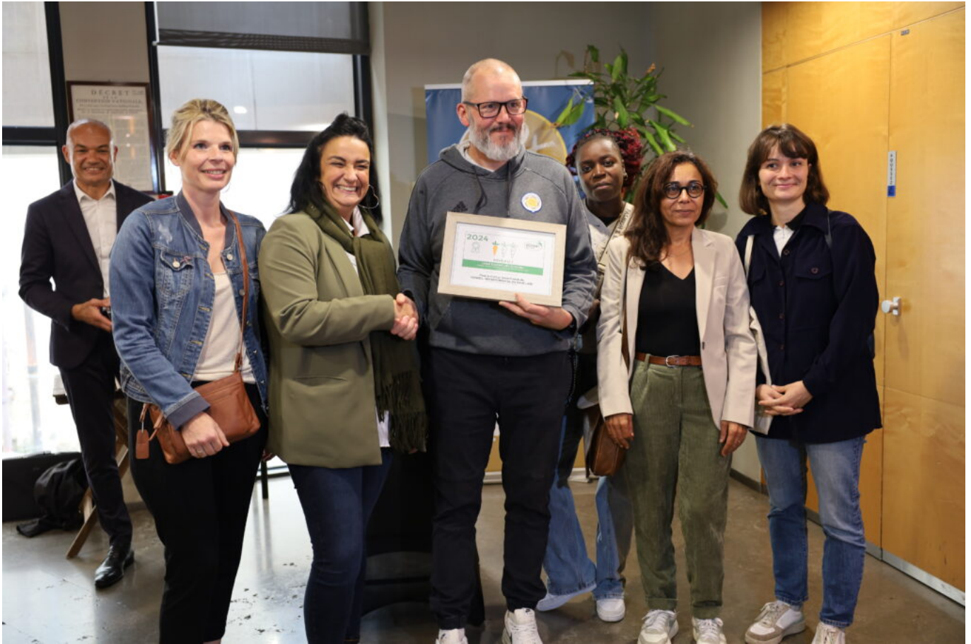
Collège Anne Franck, Morières-lès-Avignon