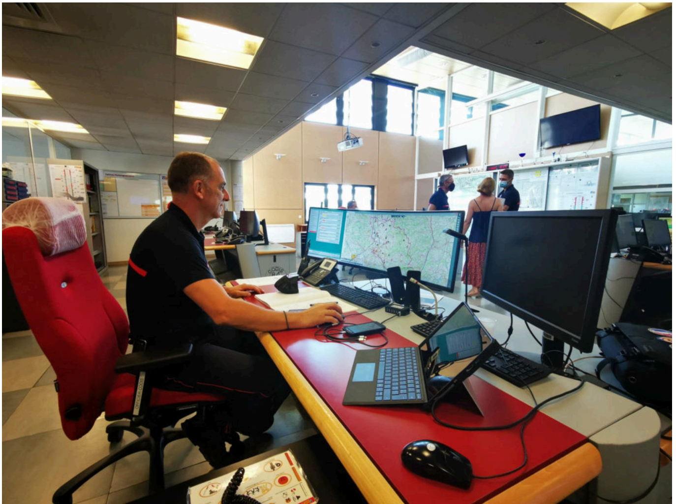
Capitaine Christophe Arnaud.

Les appels malveillants ou les fausses alertes sont des fléaux auxquels sont confrontées toutes les plateformes qui reçoivent des appels d'urgence. La sollicitation inutile est le cas où le requérant appelle les sapeurs-pompiers pour un motif qui ne le justifie pas. L' article 322-14 du Code pénal punit de deux ans d'emprisonnement et de 30 000 euros d'amende la personne qui communique ou divulgue une fausse information faisant croire à un sinistre et de nature à provoquer l'intervention inutile des secours. Le Code pénal réprime, également les appels malveillants. L' article 222-16 punit d'un an d'emprisonnement et de 15 000 euros d'amende ces appels lorsqu'ils sont réitérés et destinés à nuire. Ainsi, une personne qui submerge le standard du CTA d'appels voués uniquement à en perturber le fonctionnement commet l'infraction.