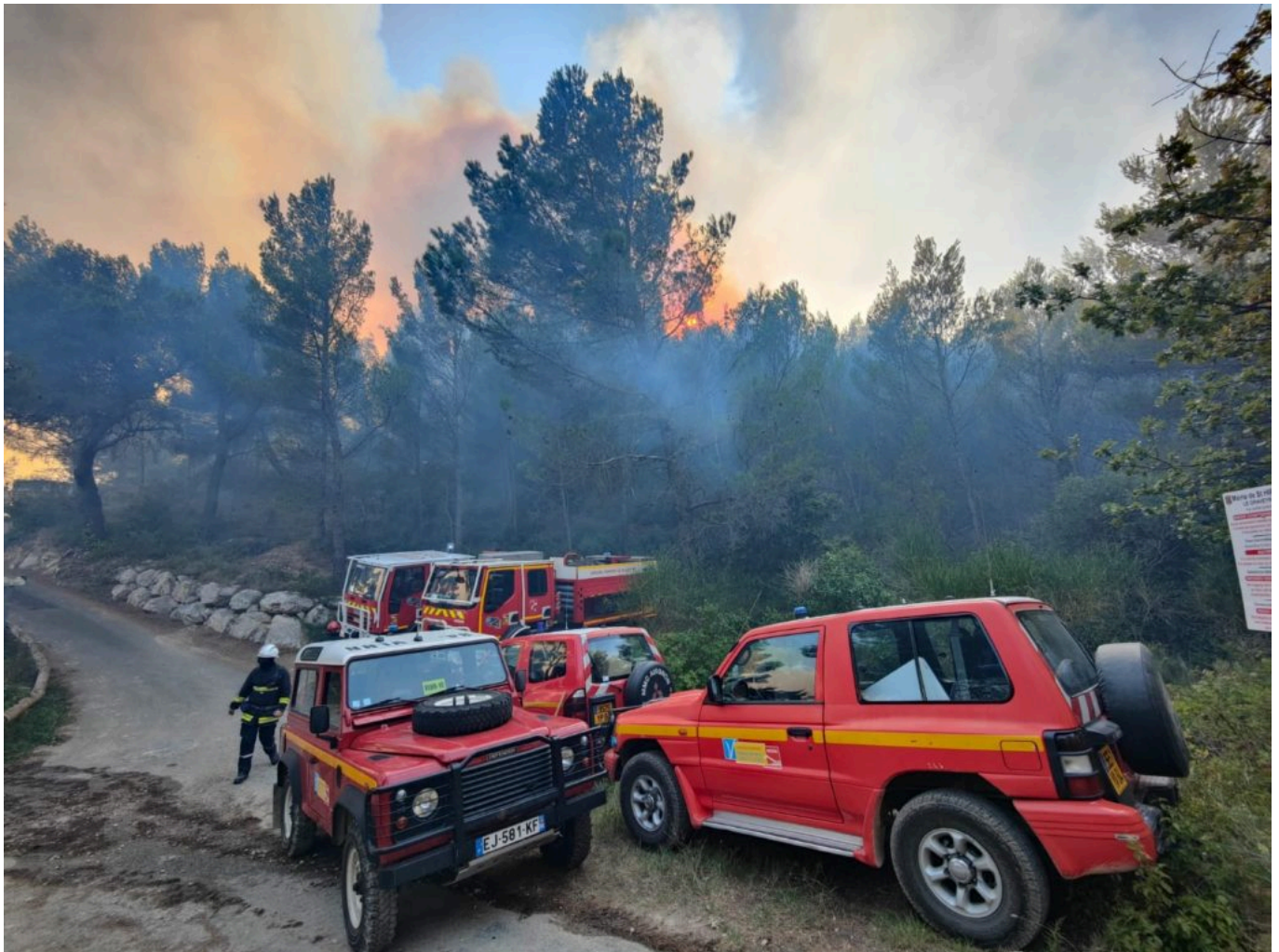
Incendie Beaumes-de-Venise.