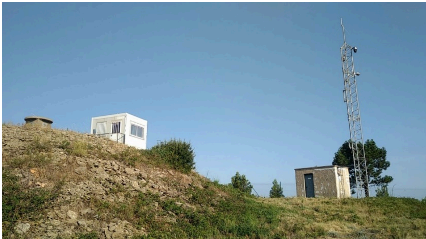
Exemple de caméra (à droite) installé au sein du département.