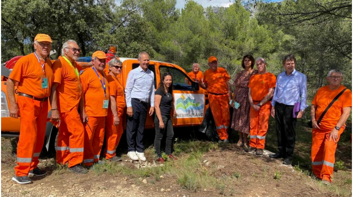
Les élus avec les bénévoles du CCFF de Cheval-Blanc.

incendiaires se retrouvent devant un tribunal ».