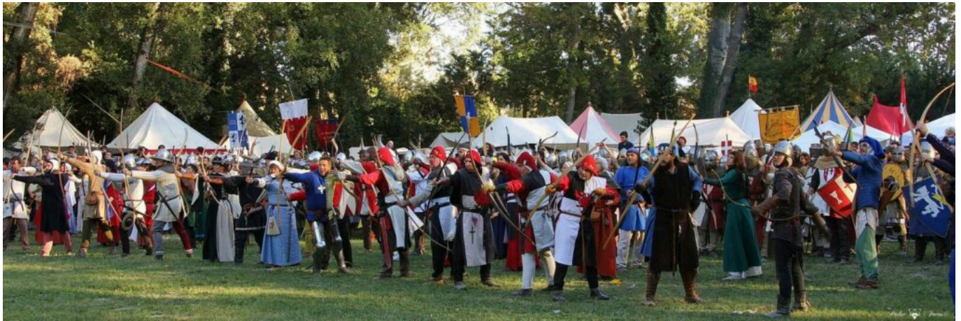
Festival médiévale de la Rose d'Or édition 2021

Le prix d'entrée est de 5 € pour les visiteurs de plus de 12 ans. Sur place, toutes les activités seront gratuites et une taverne médiévale fournira, à un prix modique, boissons et repas.