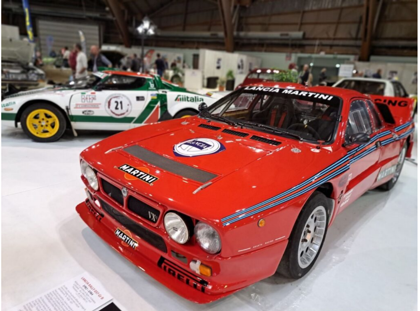
Lancia 'Rally 037' de 1982