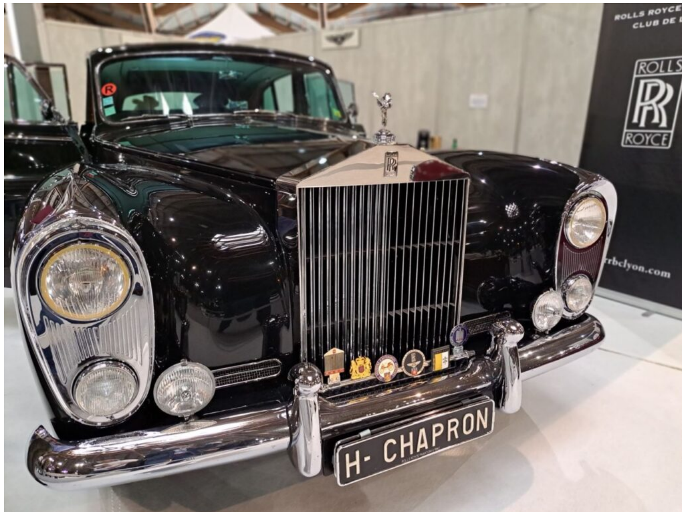
Rolls-Royce Phantom 5