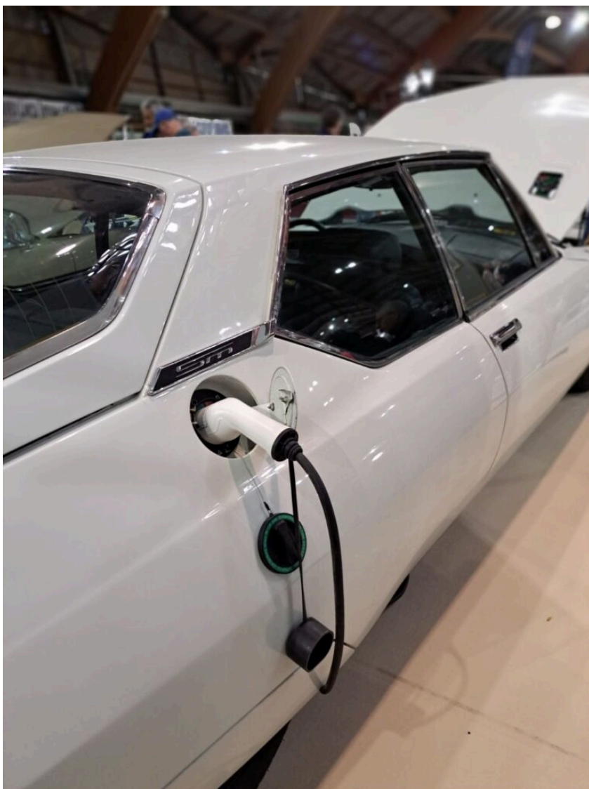
Unique SM Citroën électrique au monde

Et soudain, on tombe sur 2 SM (la voiture dans laquelle Jacques Chirac avait remonté les Champs Élysées après sa victoire en 1995. L'une, de 1972, a son carburateur. L'autre est électrique. « C'est la 1 re du genre, explique le mécano qui depuis trois ans travaille sur cette métamorphose unique au monde, Amédée Lictevout. La réglementation nous impose de conserver la boîte de vitesses, les freins, les suspensions hydrauliques d'origine. Et la batterie aussi, qui permet d'activer les feux, clignotants, le lave-vitre, le klaxon, la ventilation, le chauffage, l'antenne. »