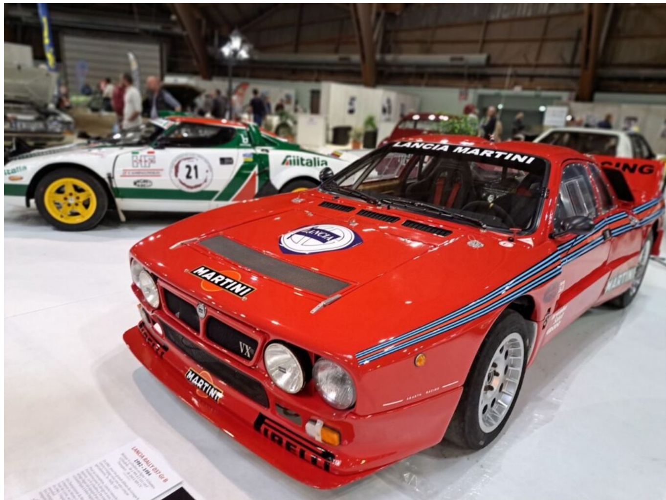
Lancia 'Rally 037' de 1982