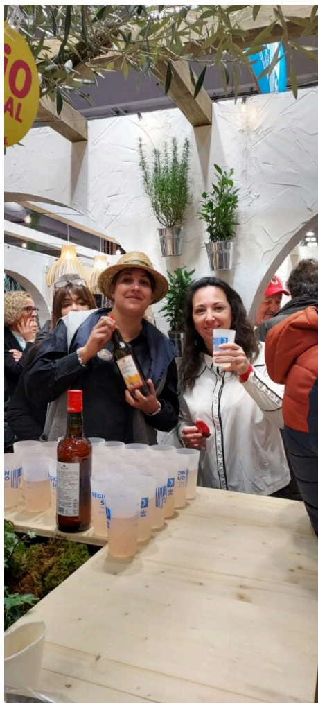
La préfète de Vaucluse (à droite) avec un verre de sirop de melon de Carpentras.

système de re-traitement des eaux usées. En Israël le chiffre de récupération est de 80%, en Espagne de 20% et nous, moins de 1%, il y a une réelle marge de progression. » Un Plan d'action de l'eau sera proposé au vote des élus du Conseil régional le 24 mars prochain à Marseille.