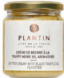
Crème de beurre à la truffe noire 3%