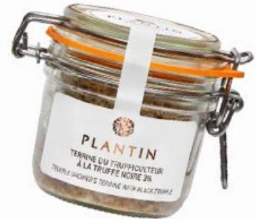
Terrine du trufficulteur au foie gras entier et à la truffe noire 3%