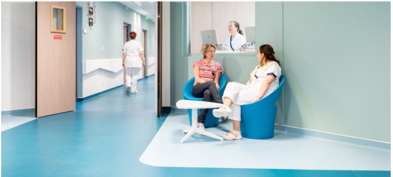
la nouvelle unité de soins Ventoux, à l'institut du cancer Sainte-Catherine à Avignon