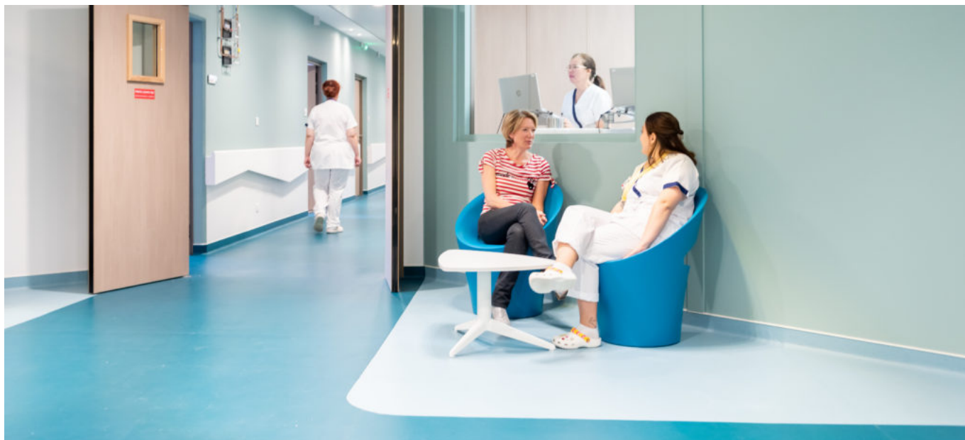
la nouvelle unité de soins Ventoux, à l'institut du cancer Sainte-Catherine à Avignon