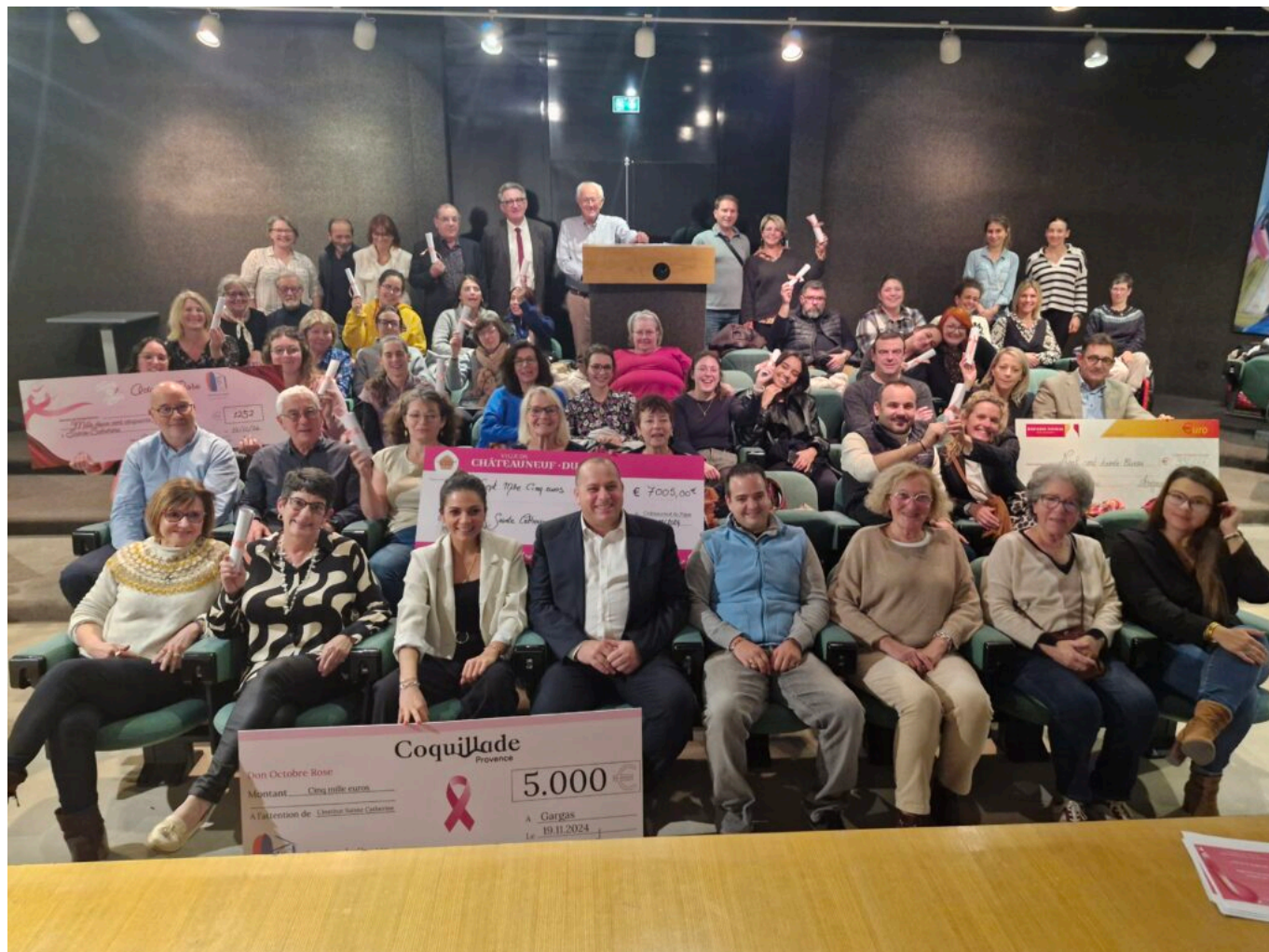
Remise des dons à l'Institut Sainte-Catherine Avignon