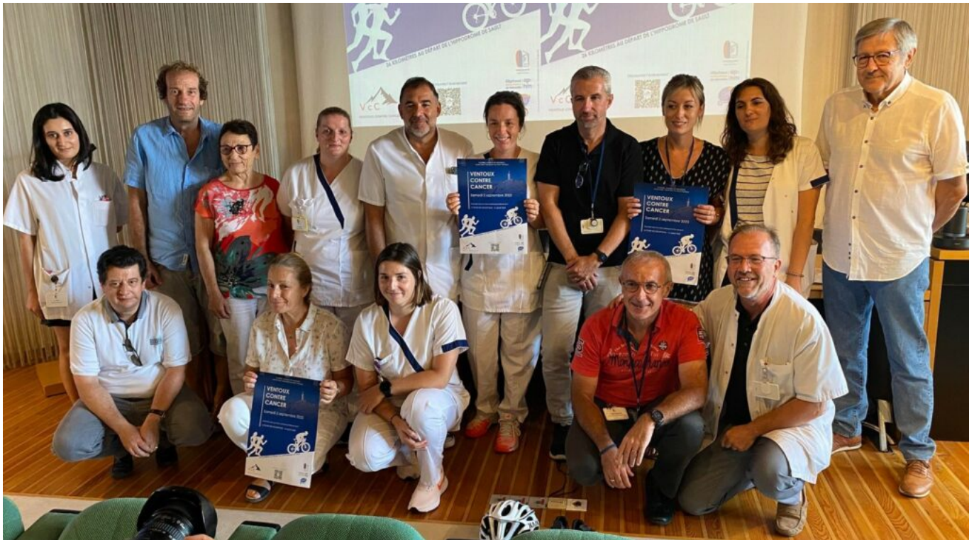
Quelques membres des deux équipes de Sainte-Catherine