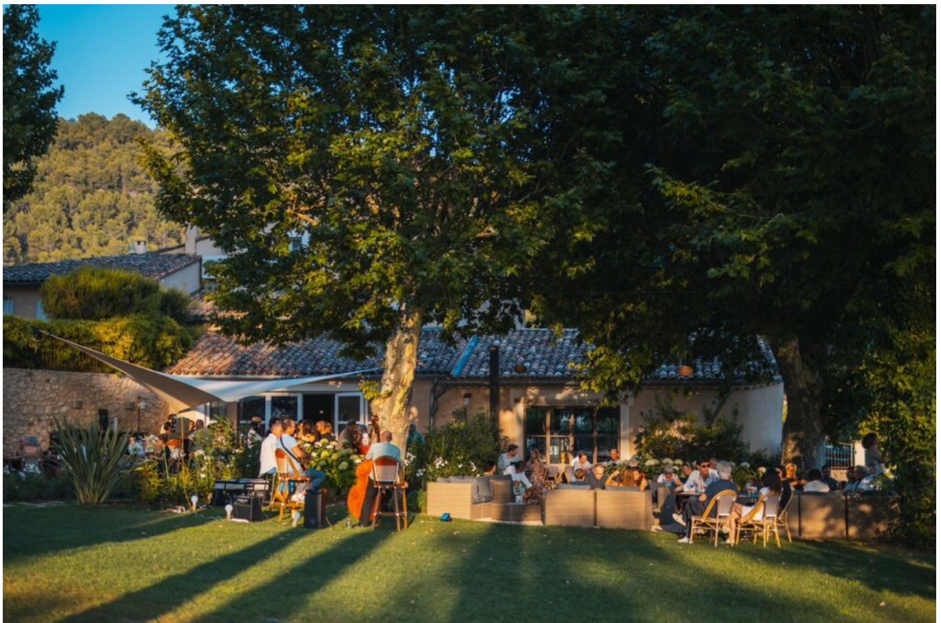
Soirée musique live dans les jardins de la Bastide.