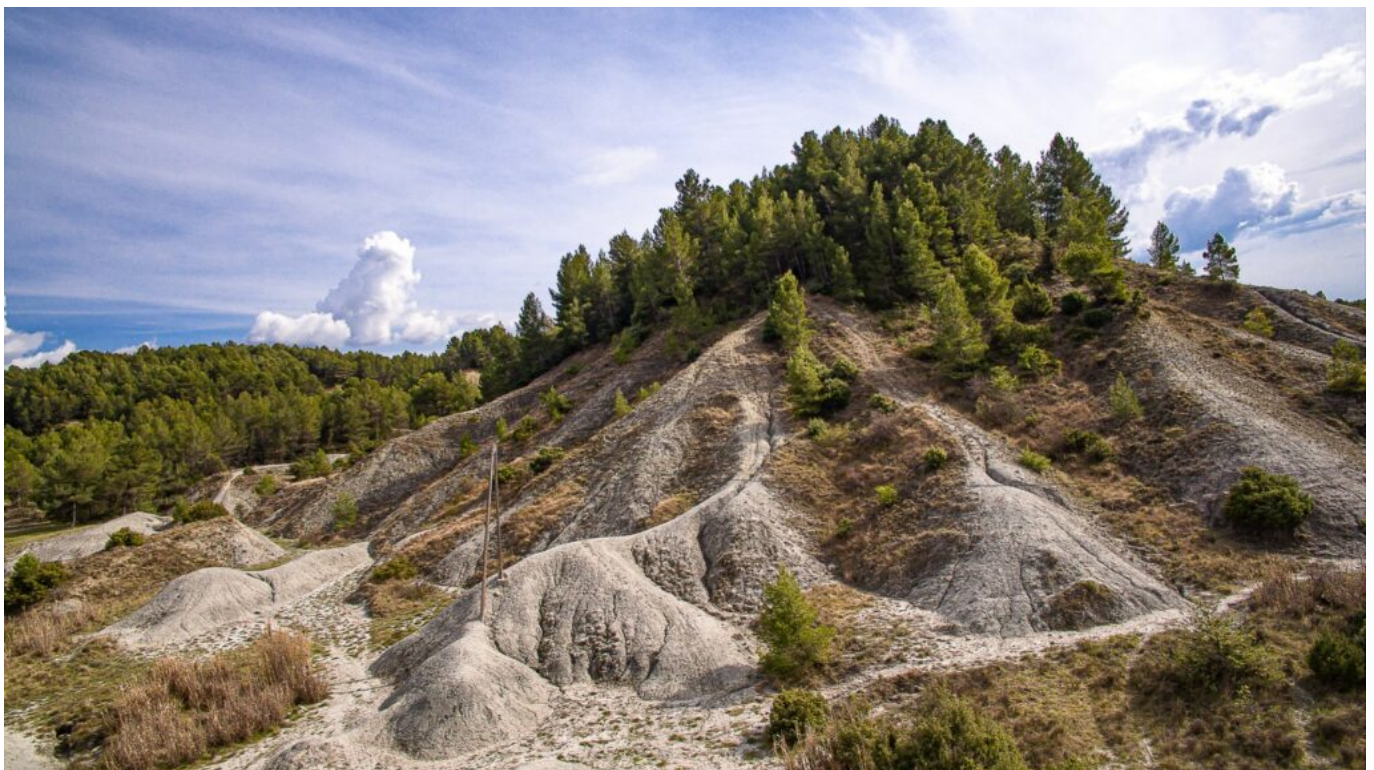
La Tuilière