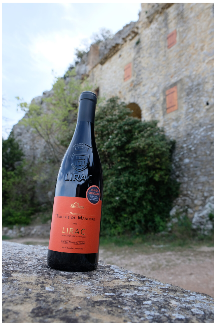
La cuvée solidaire, posée devant la Sainte-Baume.