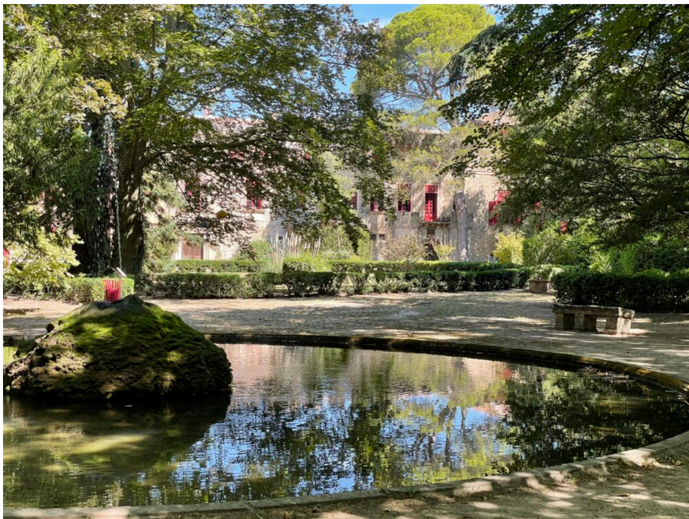
Vue du parc vers le Château

au cœur de l'histoire et de la beauté. Participez à cette renaissance et découvrez les mystères que recèle ce monument exceptionnel. Ensemble, faisons briller à nouveau le 'Diamant de Provence'.