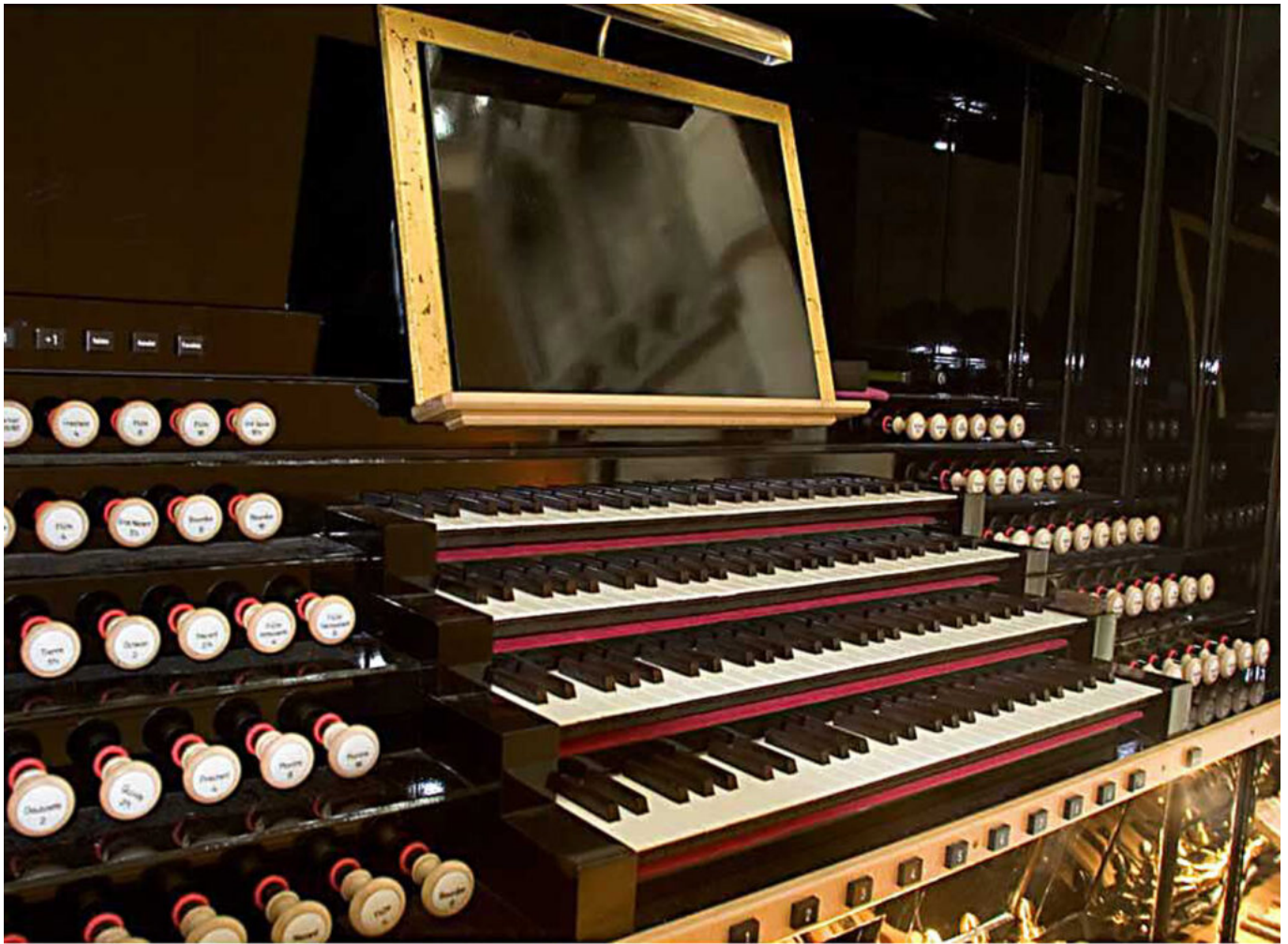
Console de l'orgue d'Evreux