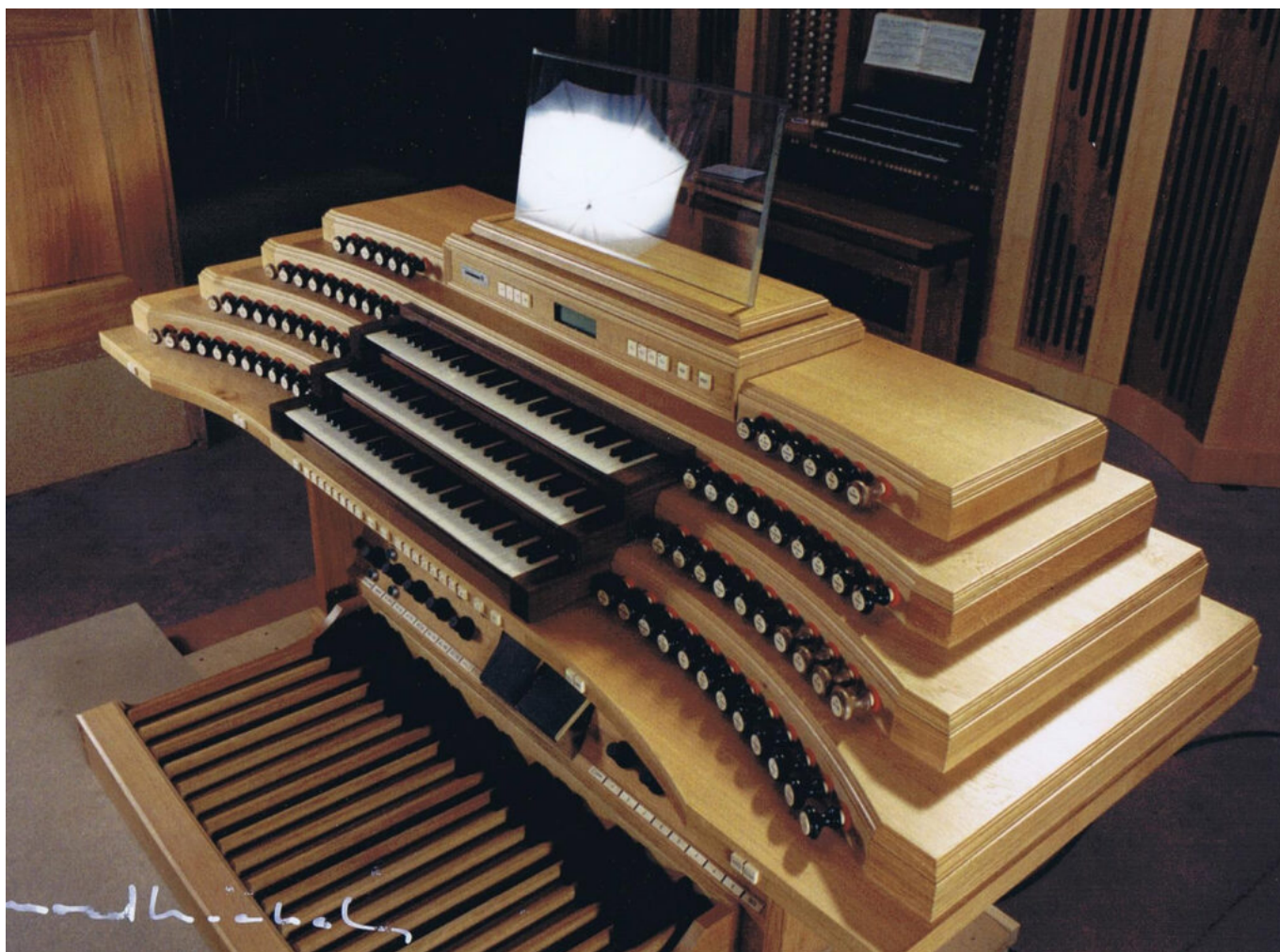
Console de l'orgue d'Hamamatsu