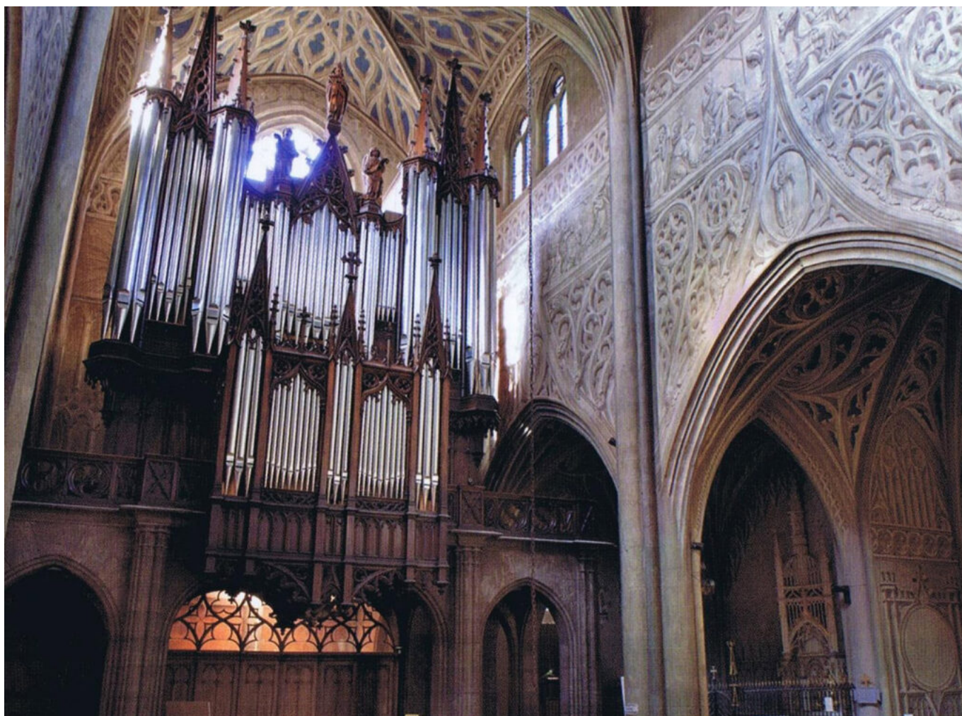
Cathédrale de Chambéry