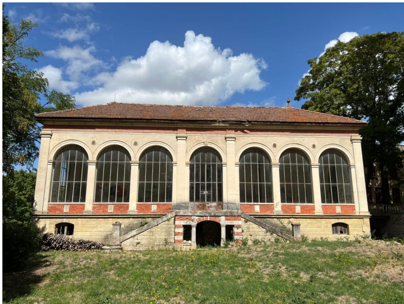
L'orangerie du Château de Thézan.

Mission Patrimoine en a sélectionné 100, dont un en Vaucluse : l'orangerie du Château de Thézan à Saint-Didier.