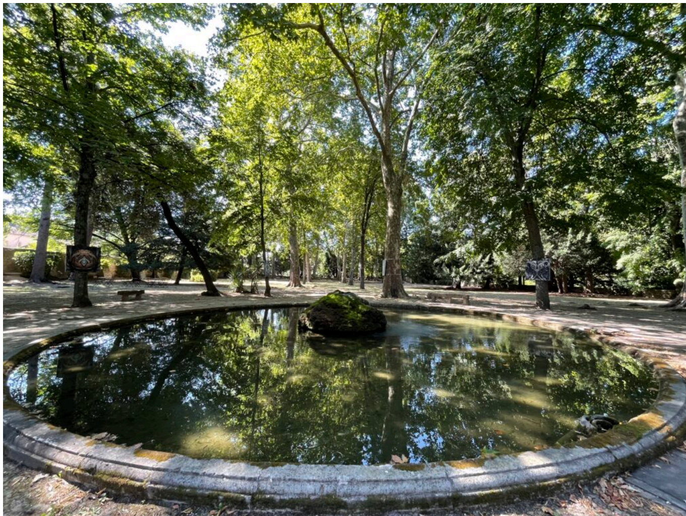
L'une des deux fontaines rocaille du Parc et ses arbres remarquables