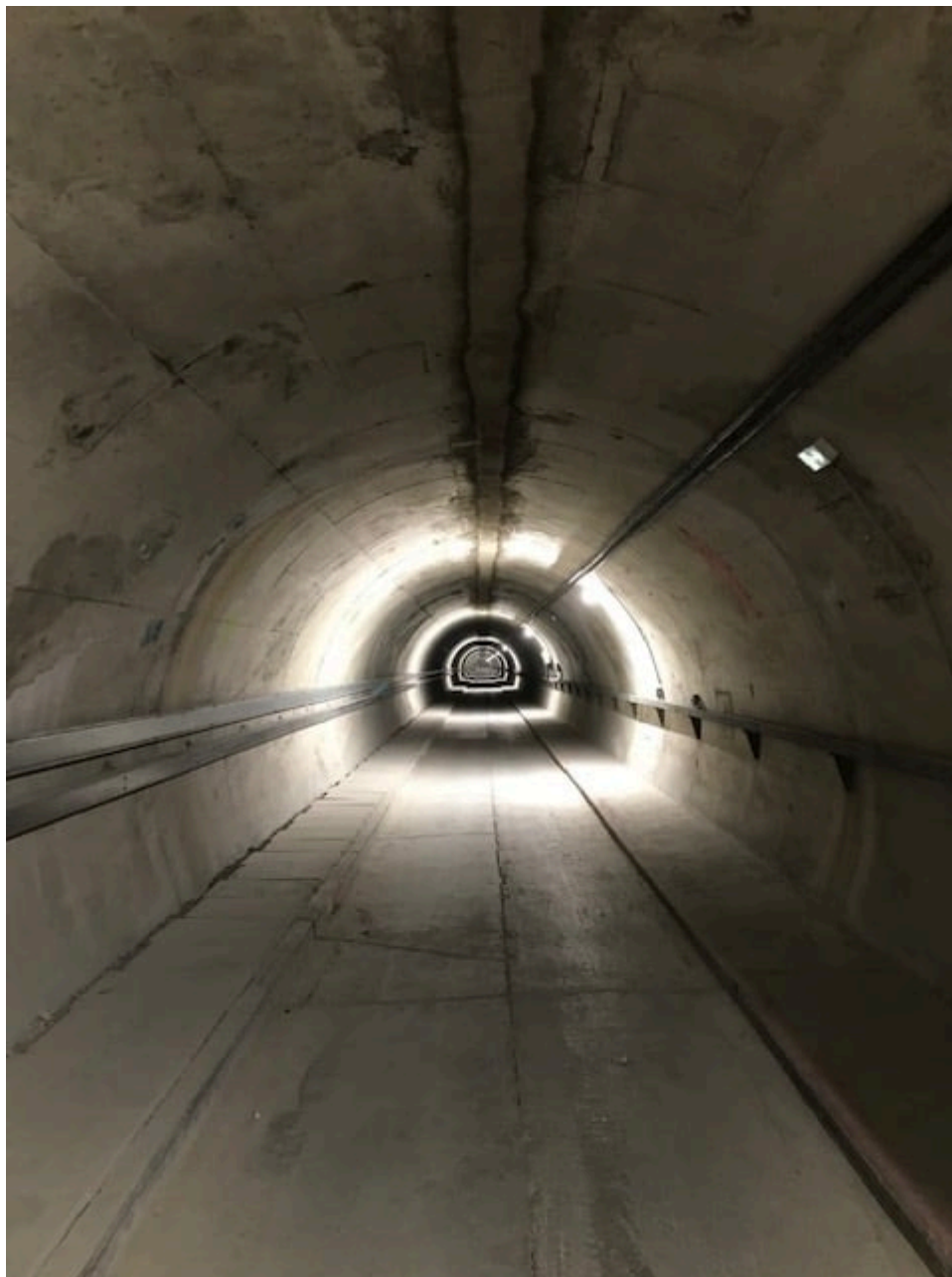
Laboratoire souterrain à bas bruit de Rustrel (LSBB)

Au sujet de 'Winlight system' : Un peu de Pertuis sur le sol de Mars