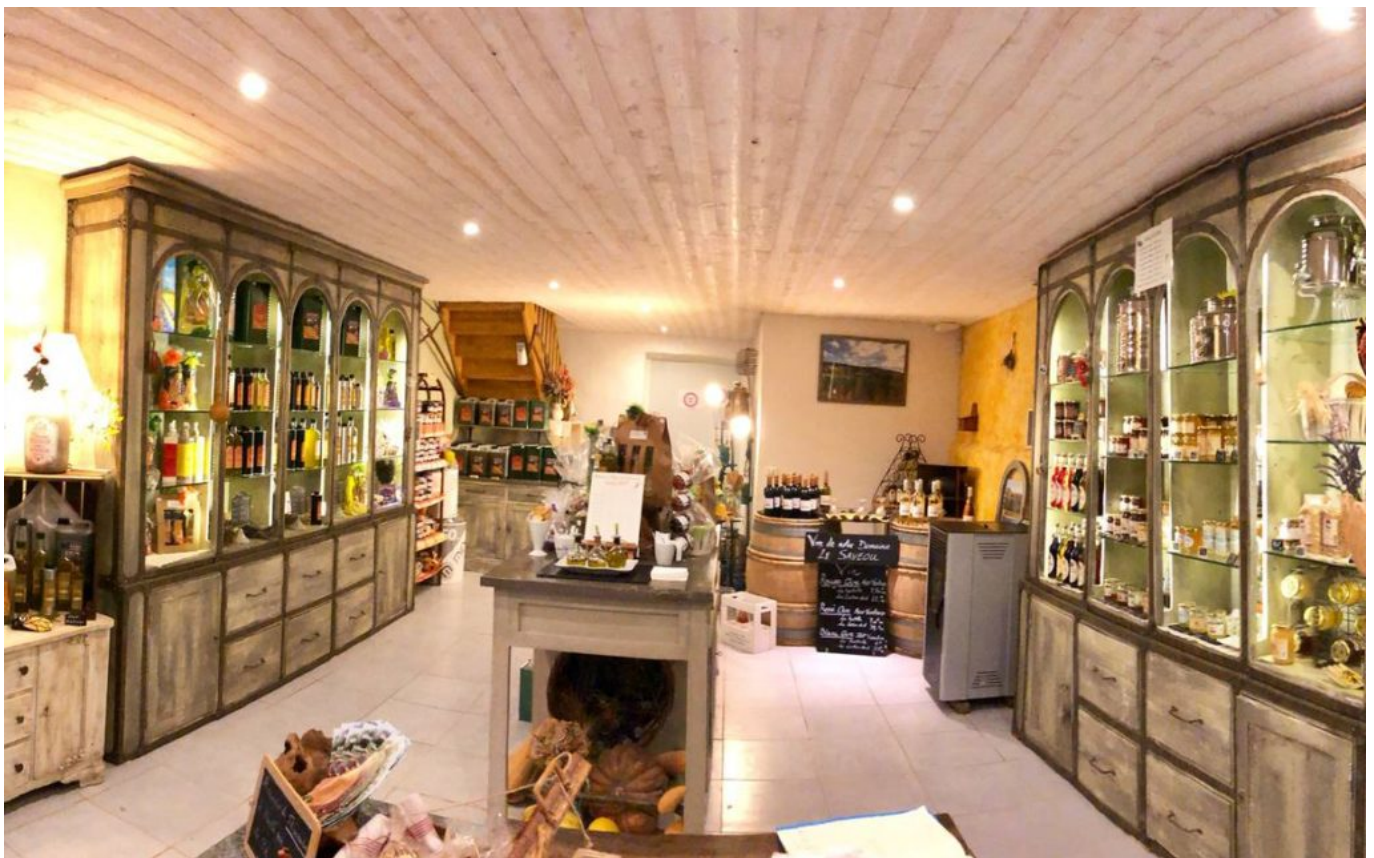
Photo: Moulin à huile de Rustrel