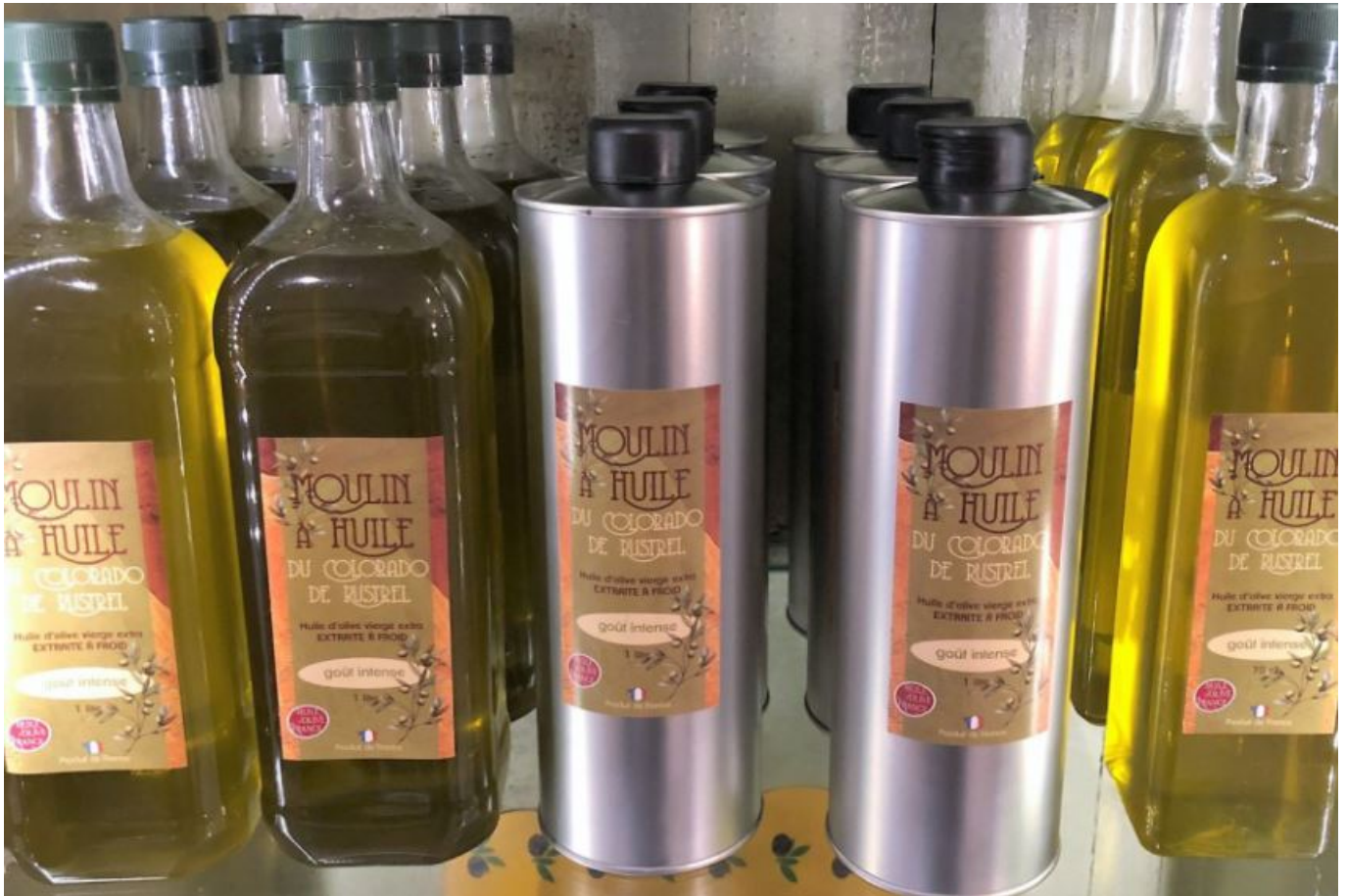
Photo: Moulin à huile de Rustrel