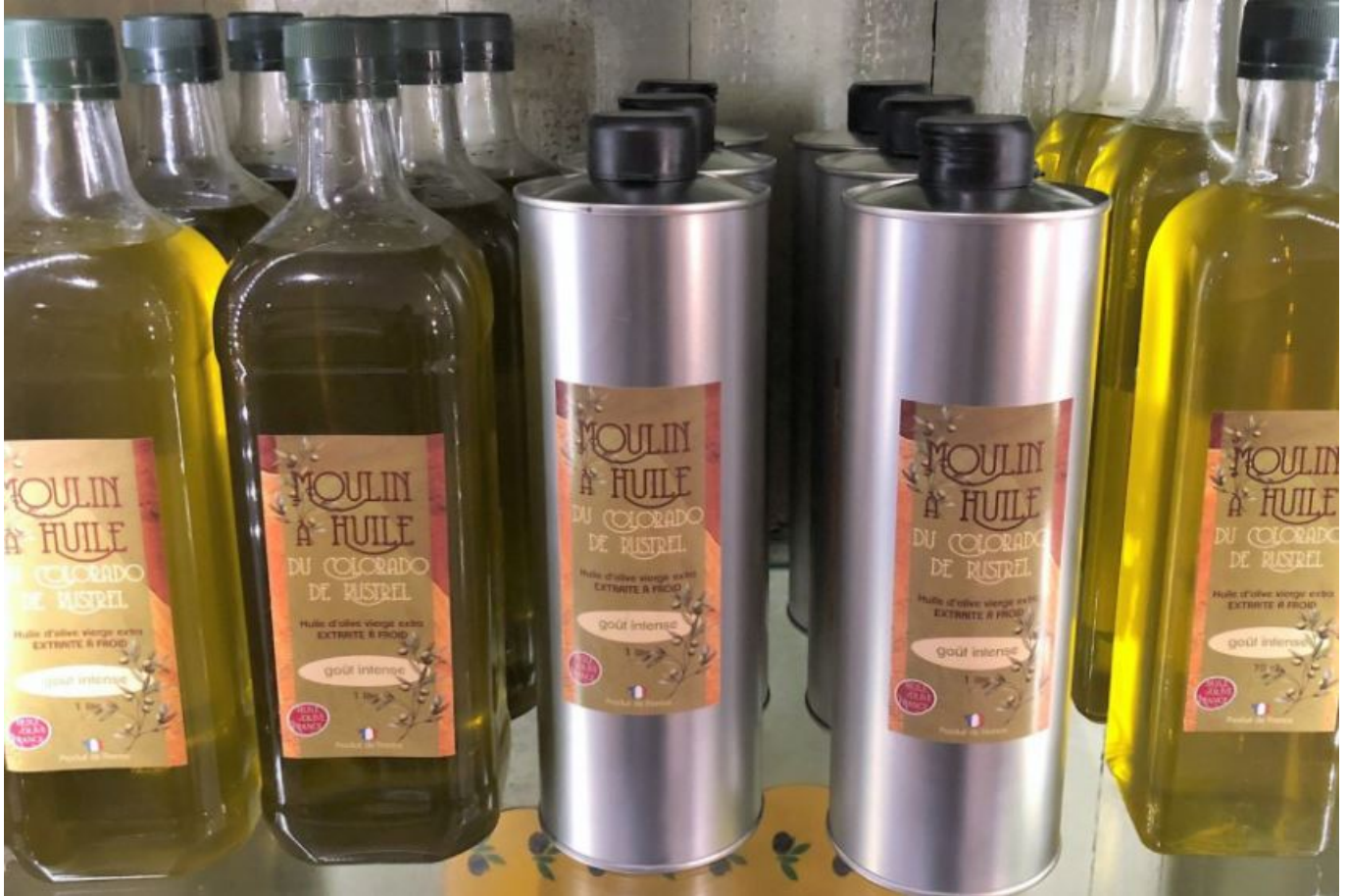
Photo: Moulin à huile de Rustrel