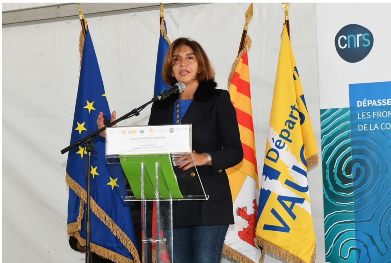
Dominique Santoni, présidente du Conseil départemental de Vaucluse.