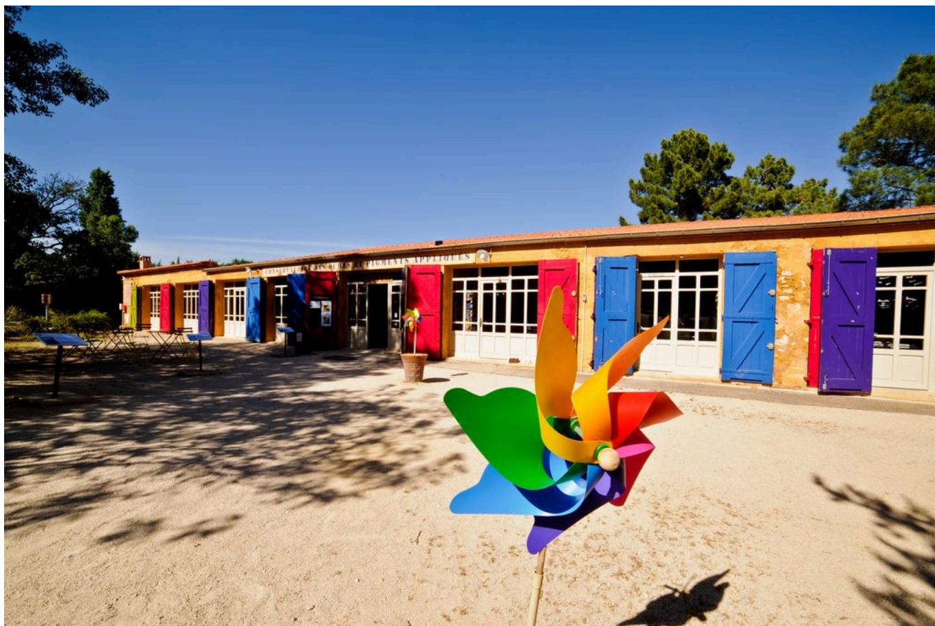
La couleur, la lumière, la vie.