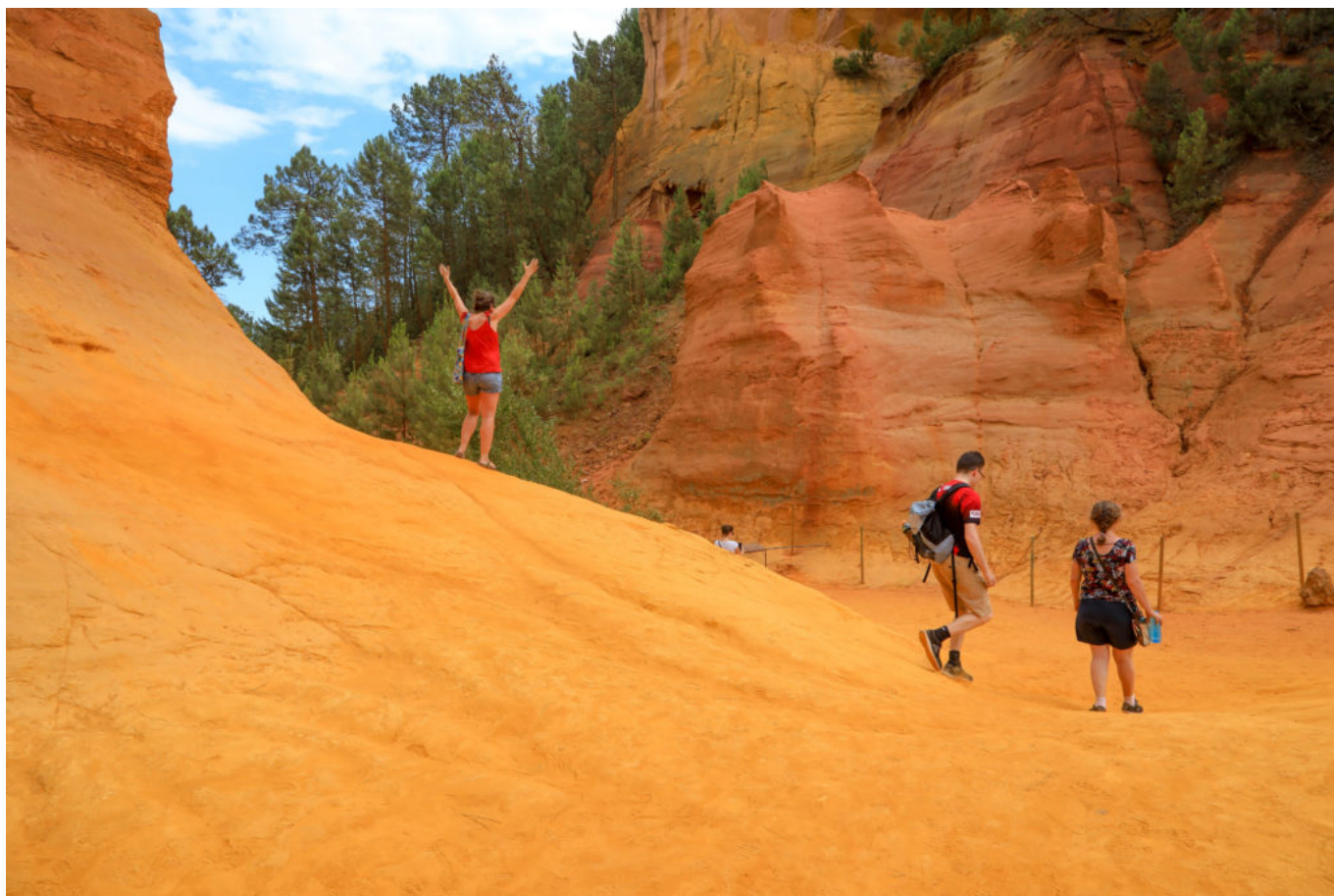
Du pigment plein les yeux aux ocres de Roussillon

Vient un jour la rencontre avec sa dulcinée, brillante autrice et conférencière en la personne de Florence Servan-Schreiber. « J'ai rencontré ma femme née à Paris sur la plage à Malibu. J'ai l'impression que le scénario était écrit... », se remémore-t-il. Madame faisait ses études, monsieur lançait une première société de production à Los Angeles au côté de Benjamin de Rothschild. L'évidence au premier regard. A l'époque, le beau-père, Jean-Louis Servan-Schreiber, est membre du conseil municipal de Roussillon. « J'ai épousé Florence sur la place du village en 1989, mon beau-père nous a mariés », certaines pages du livre ne souffrent ni du temps, ni des failles de la mémoire.