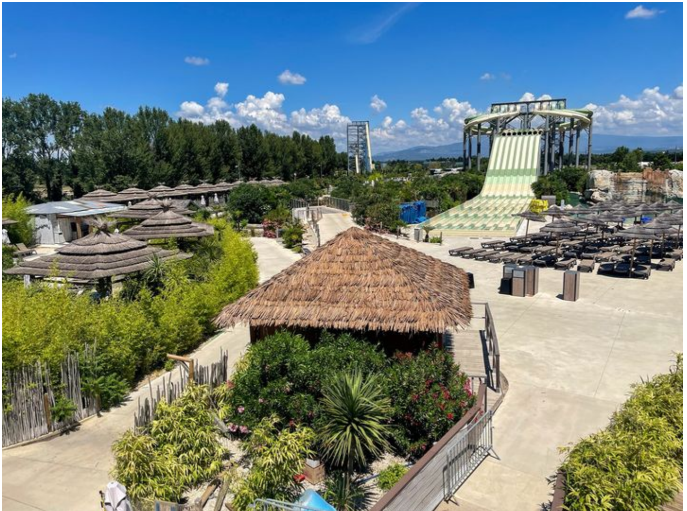
Vue splendide depuis le rooftop.

Les amis peuvent déguster planche ou tapas sur la terrasse de 'My surf city wave', ou face à Da wave , la plus grande vague artificielle du monde, certifiée au Guinness World of records (voir vidéo ci-dessous). Le bar du Wave corner plonge dans une ambiance à la californienne et s'avère être le spot incontournable de tous les amateurs de glisse du Vaucluse et de tous ceux qui souhaitent faire la fête et s'amuser. Le restaurant 'les terrasses du wave' et le 'rooftop' sont ouverts du lundi au samedi de 19h à 23h.