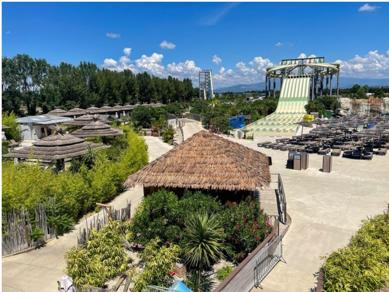
Vue splendide depuis le rooftop.

Les amis peuvent déguster planche ou tapas sur la terrasse de 'My surf city wave', ou face à Da wave , la plus grande vague artificielle du monde, certifiée au Guinness World of records (voir vidéo ci-dessous). Le bar du Wave corner plonge dans une ambiance à la californienne et s'avère être le spot incontournable de tous les amateurs de glisse du Vaucluse et de tous ceux qui souhaitent faire la fête et s'amuser. Le restaurant 'les terrasses du wave' et le 'rooftop' sont ouverts du lundi au samedi de 19h à 23h.