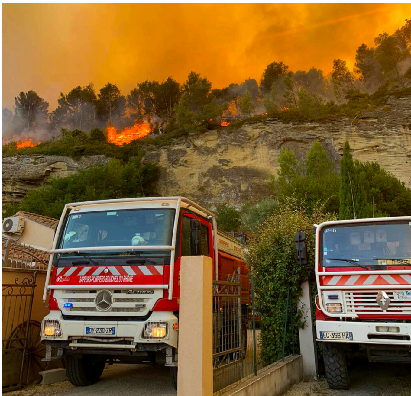
Le feu de la Montagnette à Barbentane qui a détruit plus 1 440 hectares ces derniers jours.