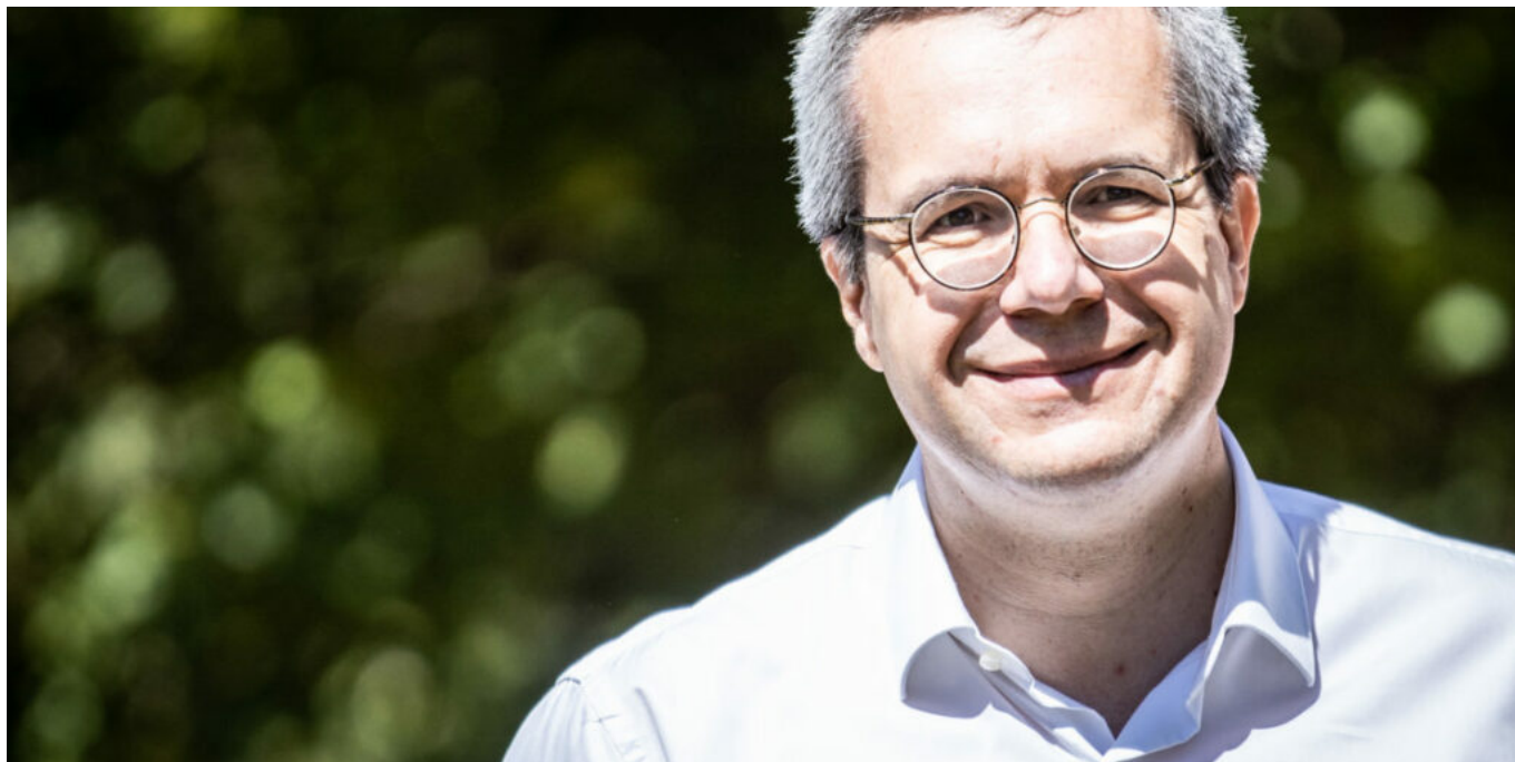
Le sénateur Jean-Baptiste Blanc

Cet amendement prévoit d'instaurer, par un prélèvement sur les recettes de l'État, une dotation de soutien à la défense contre les incendies dans les territoires ruraux. Cette dotation prendrait en charge 75% des dépenses d'équipement en points d'eau contre l'incendie et des dépenses consacrées à leur entretien.