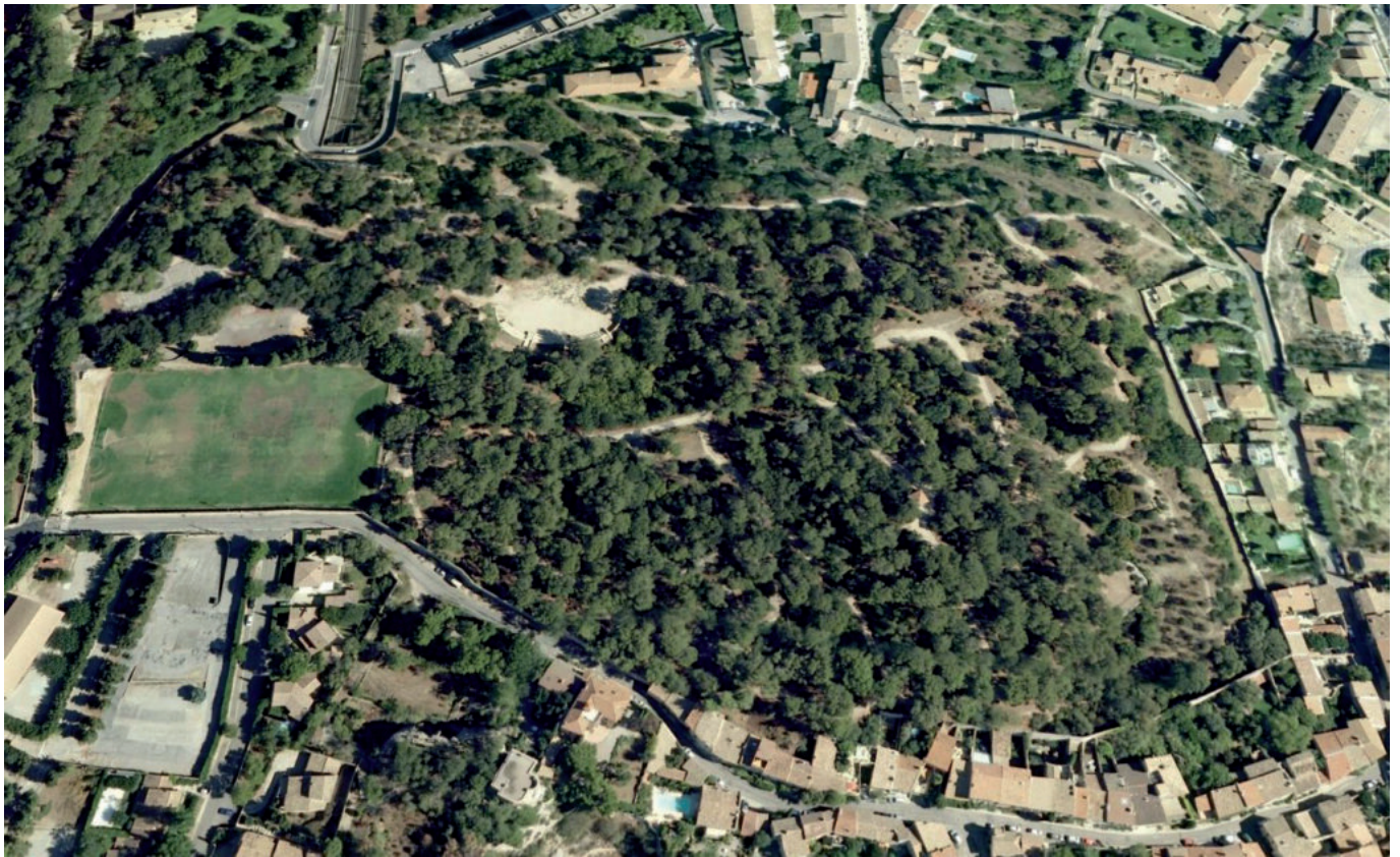
La colline des Mourgues : 7ha de forêt en plein coeur de ville.