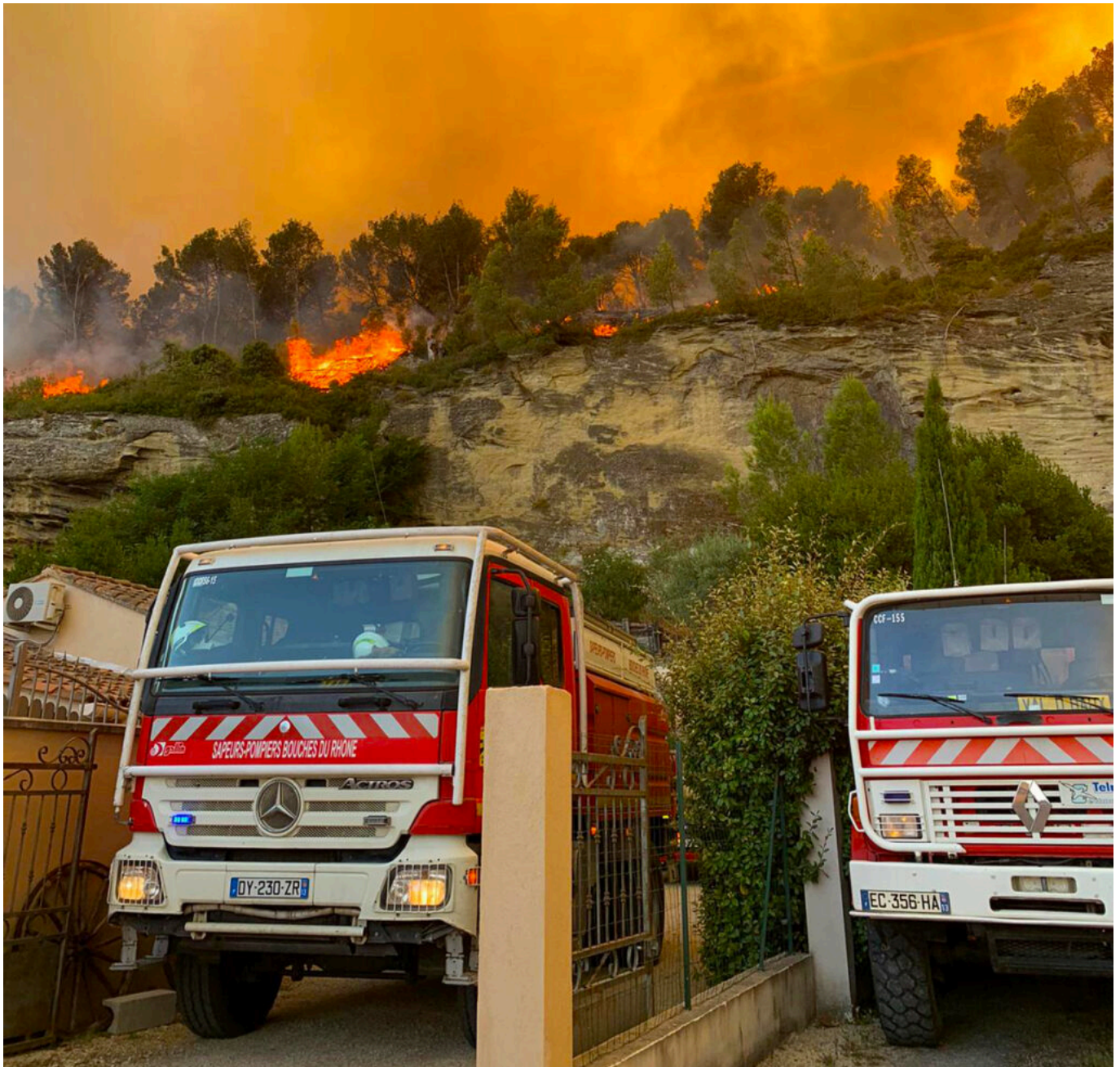
Le feu de la Montagnette à Barbentane qui a détruit plus 1 440 hectares ces derniers jours.