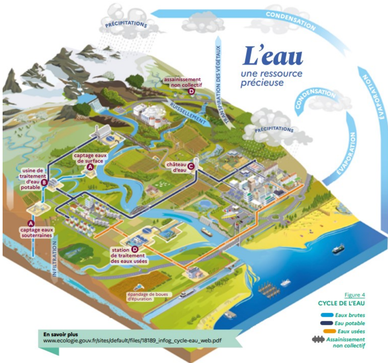
Schéma du cycle de l'eau