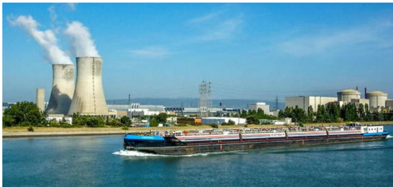
Centrale de Tricastin, image d'archive

Si l'agriculture est la première activité consommatrice d'eau à hauteur de 58% devant l'eau potable qui, elle, intervient à 26%, le refroidissement des réacteurs des centrales nucléaires électriques monte sur la 3 e place du podium avec 12% de consommation d'eau, de la consommation totale française, d'après le service des données et études statistiques du Ministère de la Transition écologique.