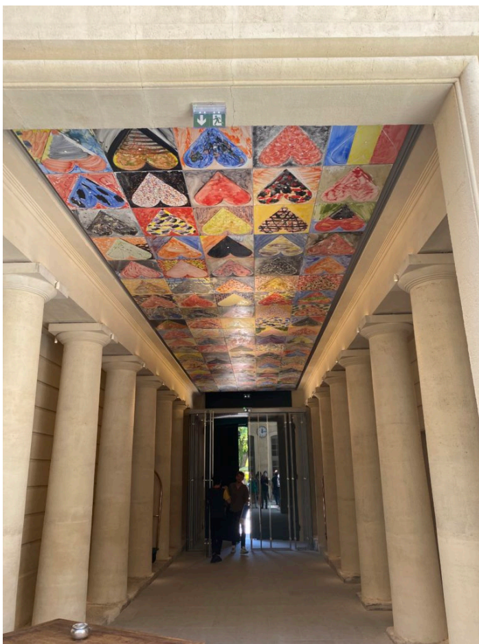
Le plafond 'Jim Dine'.

L'hôtel Richer de Belleval rénové accueille en son sein un espace d'expositions temporaires de prestige animé par la fondation GGL Helenis (promoteur immobilier). Deux à trois fois par an, des expositions d'illustres artistes contemporains nationaux et internationaux s'y tiendront. Des conférences pourraient également y être organisées. La première exposition temporaire est consacrée à l'Américain Jim Dine, qui a également créé une œuvre en céramique composée de 105 cœurs apposés sur le plafond du hall d'entrée, intitulée 'Faire danser le plafond'.