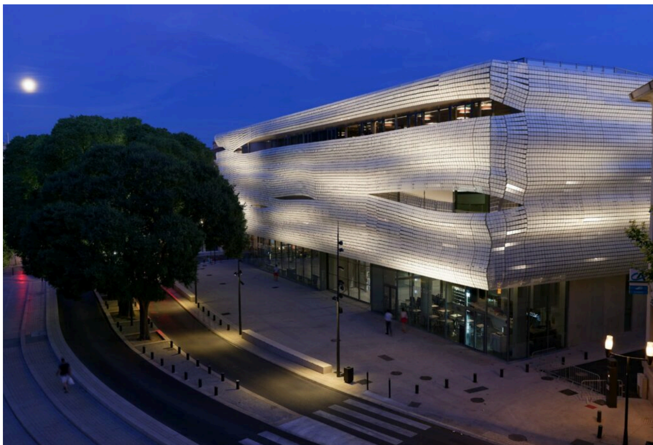
Le Musée de la Romanité.