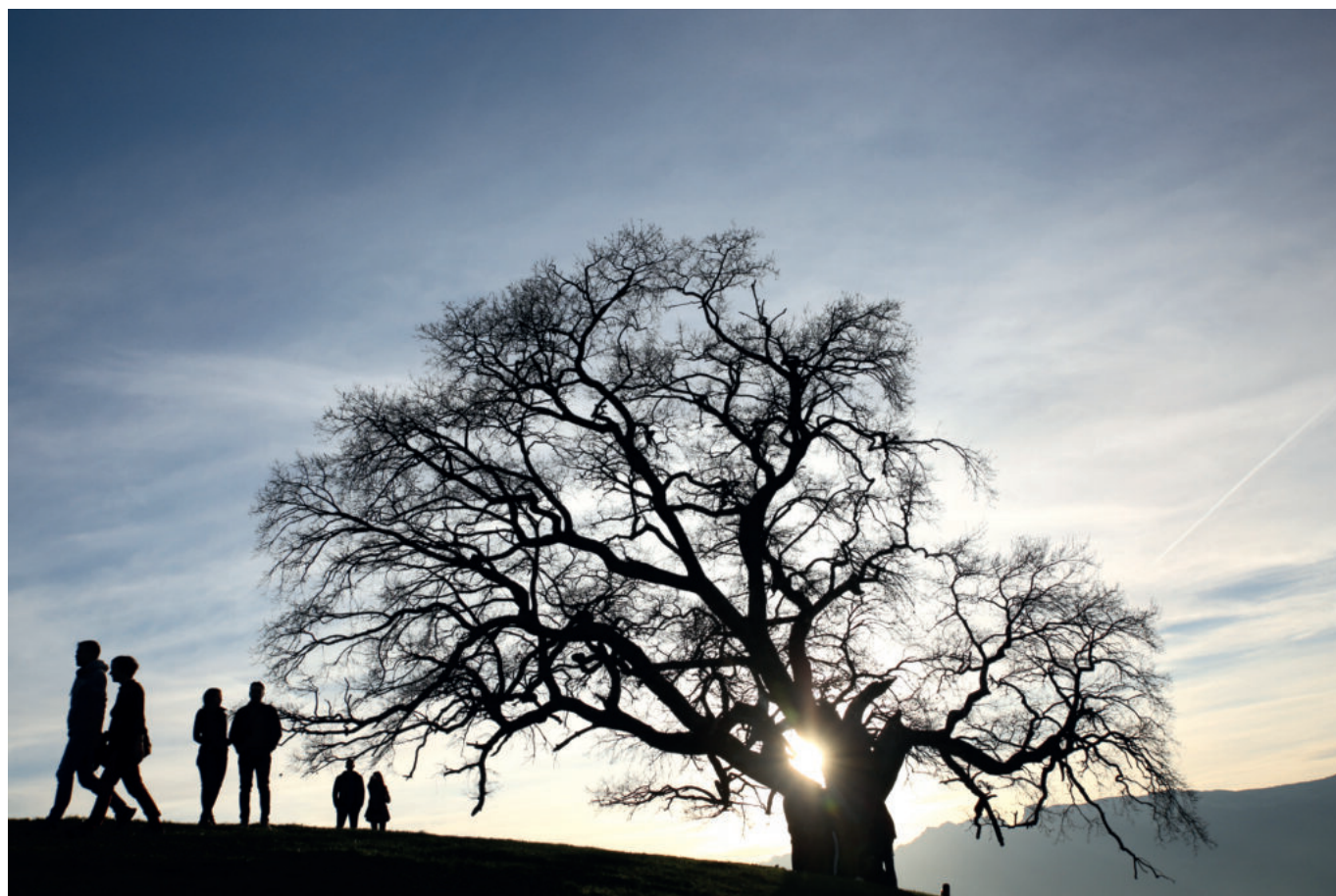
Le chêne de Venon est réputé pour être l'arbre le plus photographié des Alpes françaises