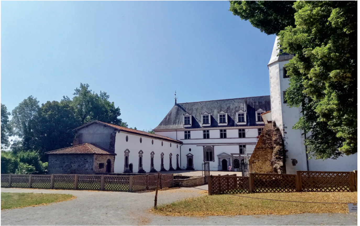
Le site au charme si particulier