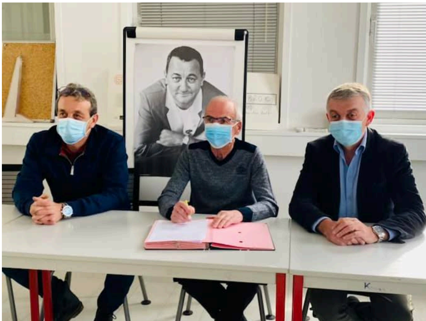
Signature de la convention entre l'AMV et les Restos du cœur Vaucluse.

L'Association départementale de Vaucluse souhaite ainsi consolider le partenariat avec l'Association des maires de Vaucluse (AMV) ainsi qu'avec les communes et intercommunalités, notamment celles d'implantation de ses centres, qui, par leurs compétences et leur proximité, sont les premiers interlocuteurs institutionnels des Restos du cœur.