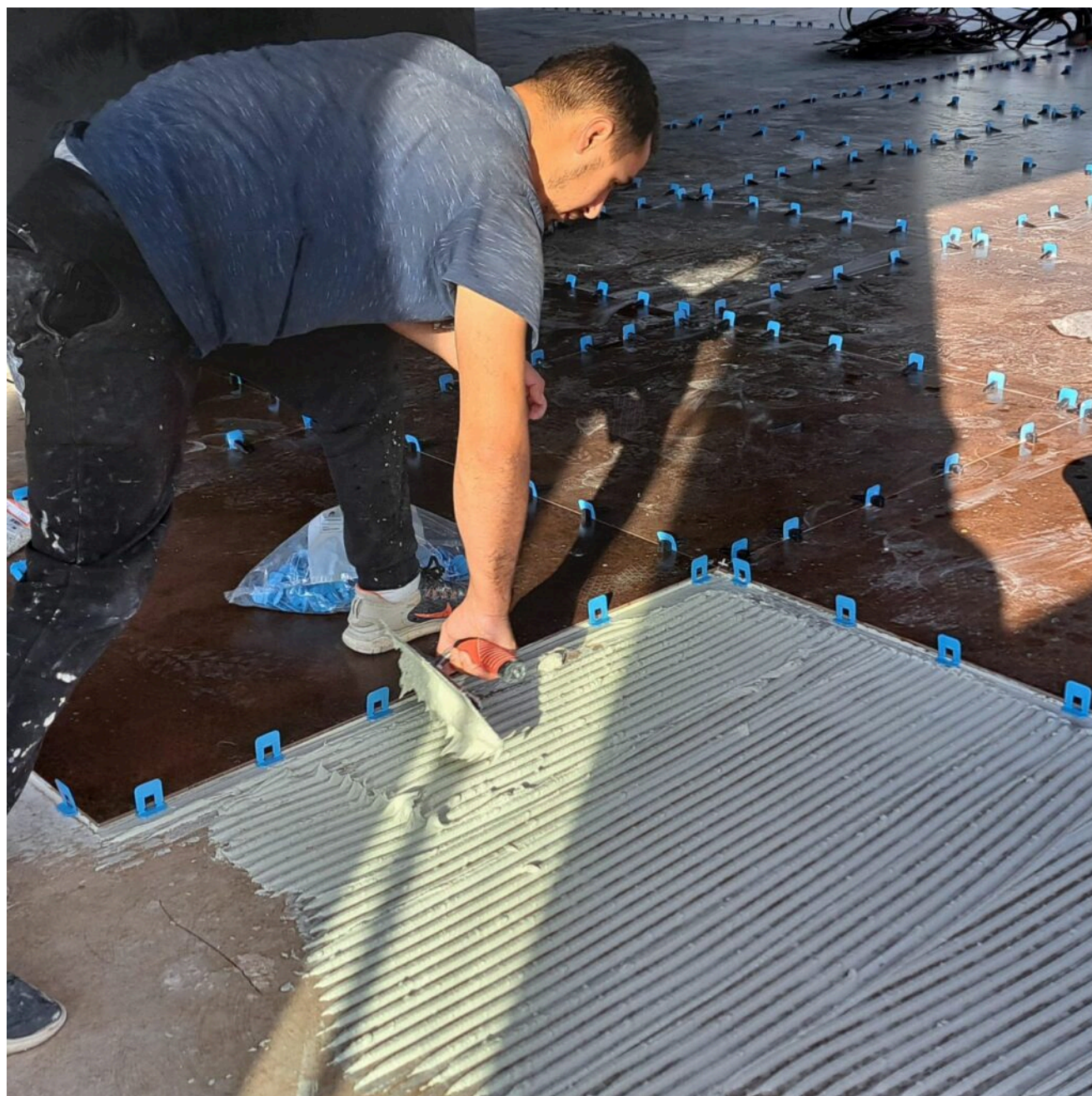
Pose du carrelage