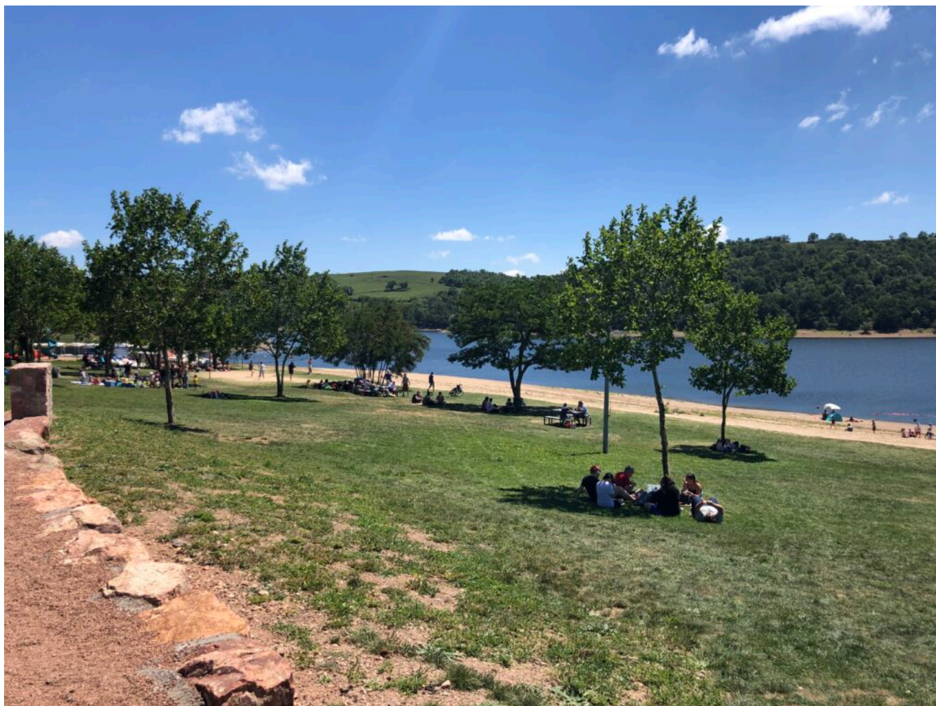
Le lac de Villerest