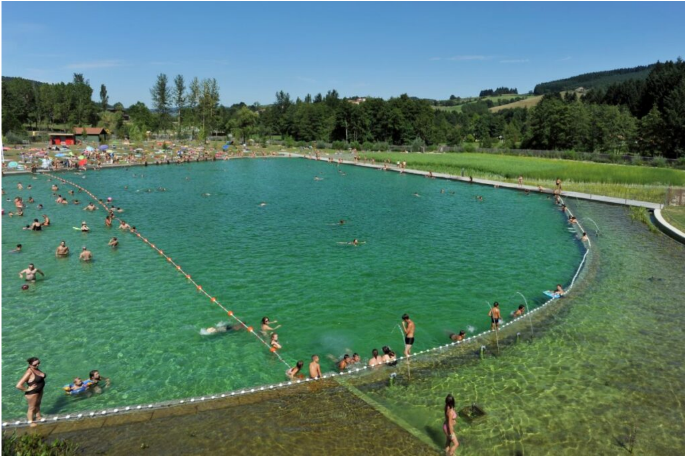
Piscine naturelle au lac des Sapins

Pour les adeptes des parcours aventure, cap sur la Forêt de l'aventure qui propose quatre parcours aventure pour quatre niveaux de difficultés et sept tyroliennes sur le site Lac des Sapins, accessibles à tous. Pour les enfants, les parcours s'effectuent en ligne de vie continue et les adultes ont des mousquetons « intelligents », donc impossible de se détacher avant la fin du parcours. En cas de petite faim, on peut se restaurer sur place ou quitter le site pour Thizy-les-Bourg, à quelques encablures du lac des Sapins. Le New Gambetta propose une cuisine traditionnelle mais raffinée. Derrière une façade relativement anonyme, on passe dans un monde de saveurs et de convivialité. L'été est propice à ce bon moment de table grâce avec une terrasse ombragée. La salle intérieure est tout aussi agréable et on pourra apprécier la qualité des produits et un service rapide et aimable. Notre conseil : la terrine artisanale, le magret de canard et le burger en plats et le tiramisu et le brownie glacé pour les desserts.