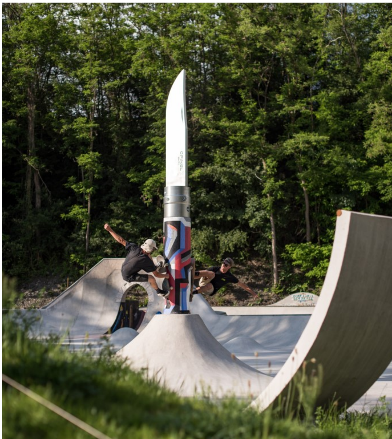
Le Volcano Opinel, une œuvre d'art skateable installée au sein du skatepark Versus.