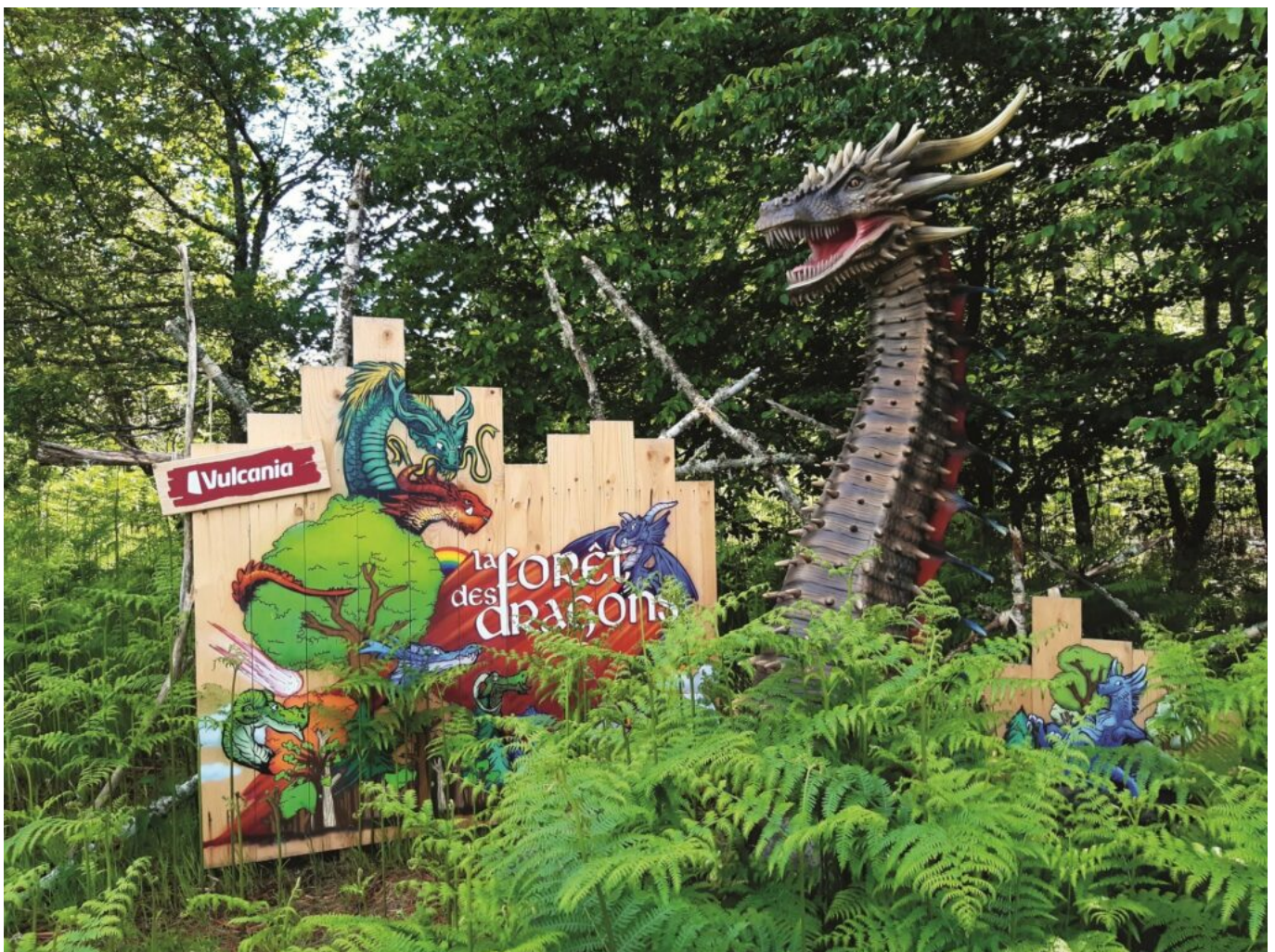
Vulcania, la forêt des dragons

Les ouragans, les séismes, les avalanches, les tsunamis... sont d'autres manifestations de la puissance de la nature. Pour comprendre ces catastrophes, connaître les bons comportements à adopter, mesurer les impacts du changement climatique, Vulcania s'intéresse à tous les phénomènes naturels de la planète et aux croyances véhiculées à travers les siècles. En parcourant la Forêt des dragons, huit légendes vous seront ainsi contées.