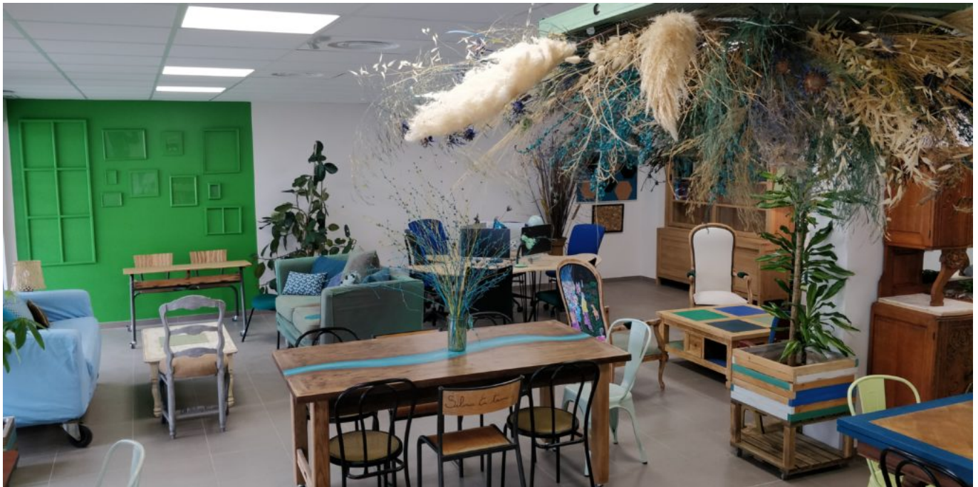
La Maison partagée pour 'faire société' de 7 à 77 ans et plus...