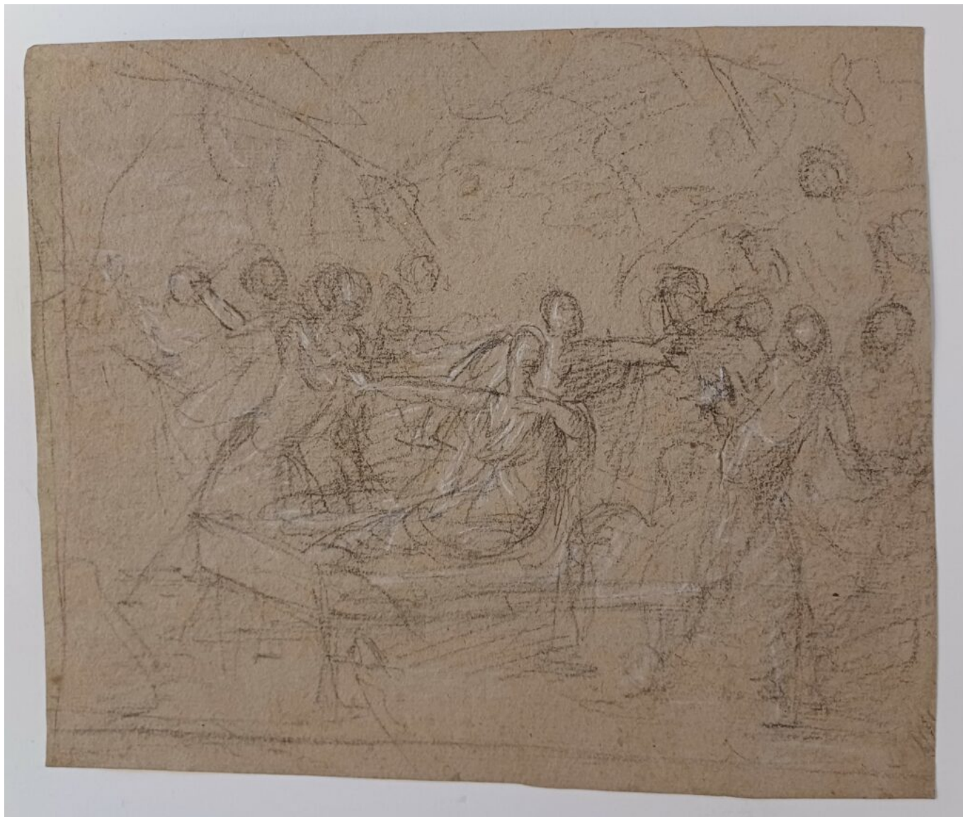
Croquis de Alfred Persia