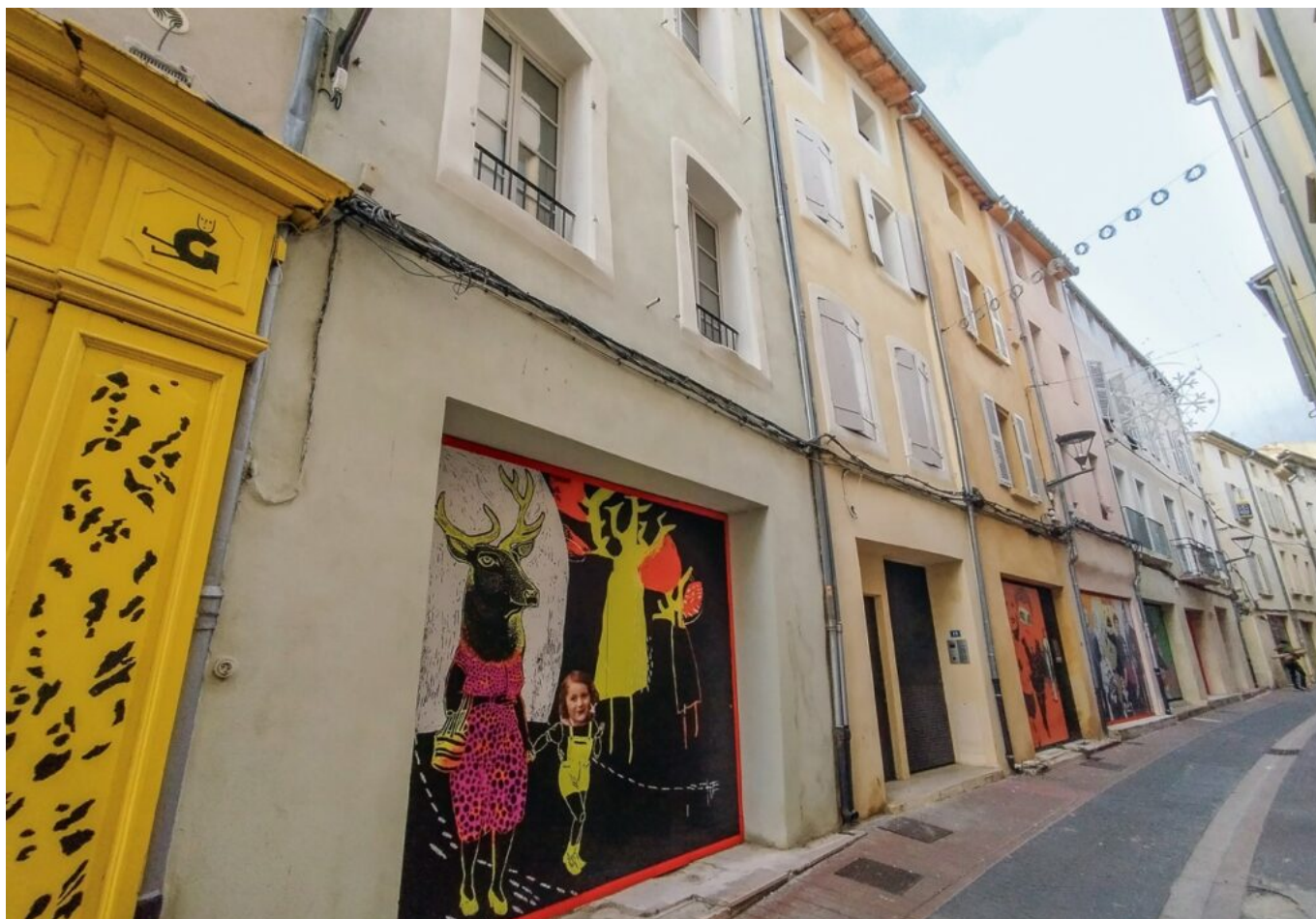
L'Îlot Raspail.