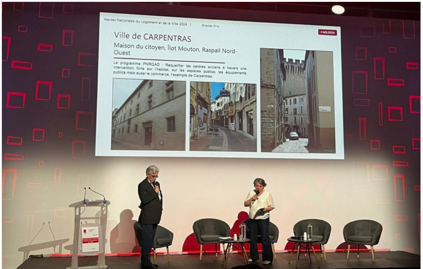
Le maire de Carpentras lors de la remise de prix.