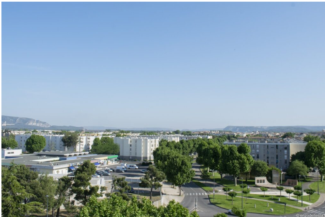
Vue du quartier du Docteur Ayme sans les 2 tours.

basse consommation). Les voiries et les espaces publics seront reconfigurés, sécurisés et embellis par la commune. Par ailleurs, j'ai acté l'implantation forte de services publics en cœur de quartier. Cet engagement a sans nul doute contribué à convaincre l'Anru du bienfondé du dossier de Cavaillon. Cela concernera notamment la construction de nouveaux locaux pour le centre social, France Services et le Point Justice, d'un nouvel accueil pour les jeunes, d'une salle multi-activités, d'une halte-garderie par l'agglomération et d'un nouveau plateau sportif. »