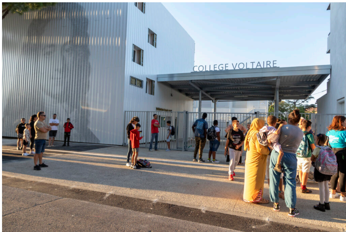
Le collège Voltaire à Sorgues