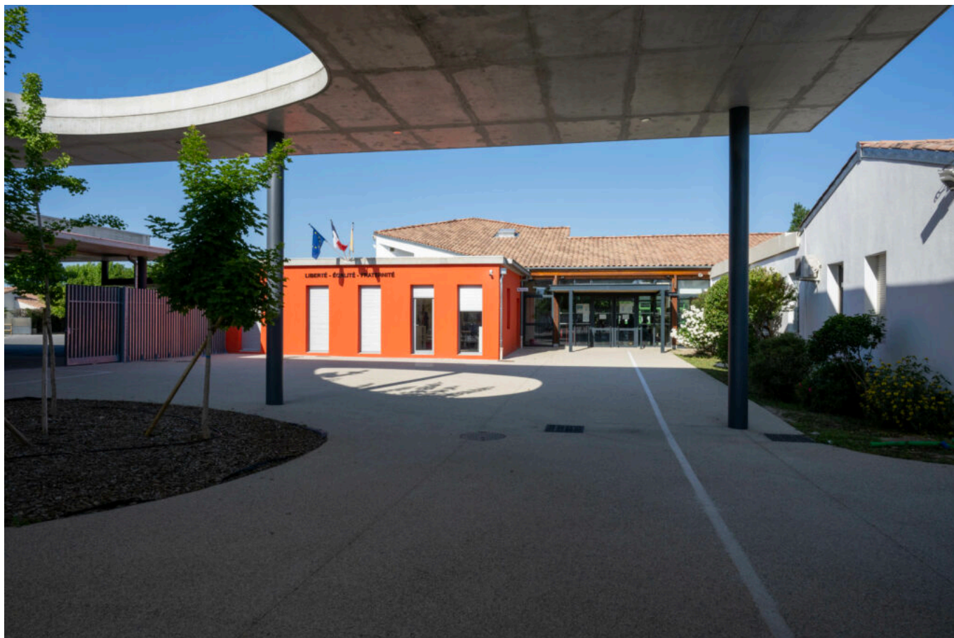
Le collège Pays-de-Sorgues au Thor

L'établissement accueillera bientôt un préau de 350m 2 pour lesquelles les fondations sont déjà terminées et la structure métallique posée pour un montant des travaux estimé à 350 000€.