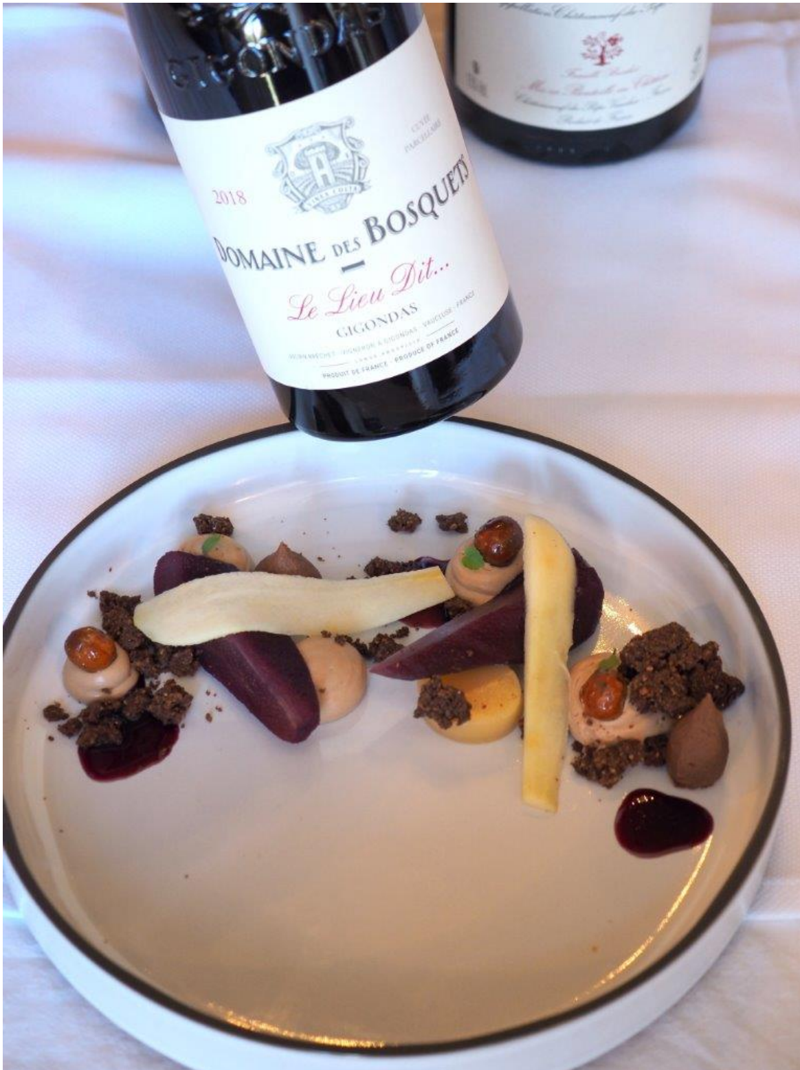
Le dessert de Thomas Glucksmann ayant remporté cette nouvelle édition des rencontres