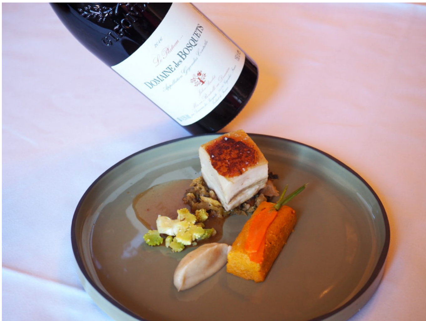
OLYMPUS DIGITAL CAMERA

Deuxième manche de ces 12èmes Rencontres Gourmandes de Vaudieu, le 24 janvier 2022.