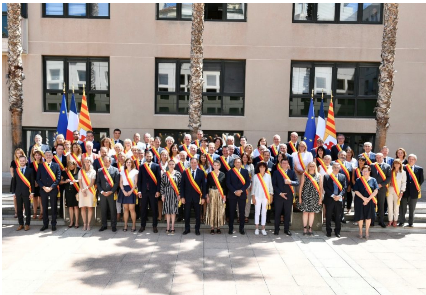
L'ensemble des conseillers régionaux.

A plus long terme, le plan climat est réaffirmé autour de deux objectifs principaux : être la première région 'neutre en carbone' et autonome pour la gestion des déchets en 2030.