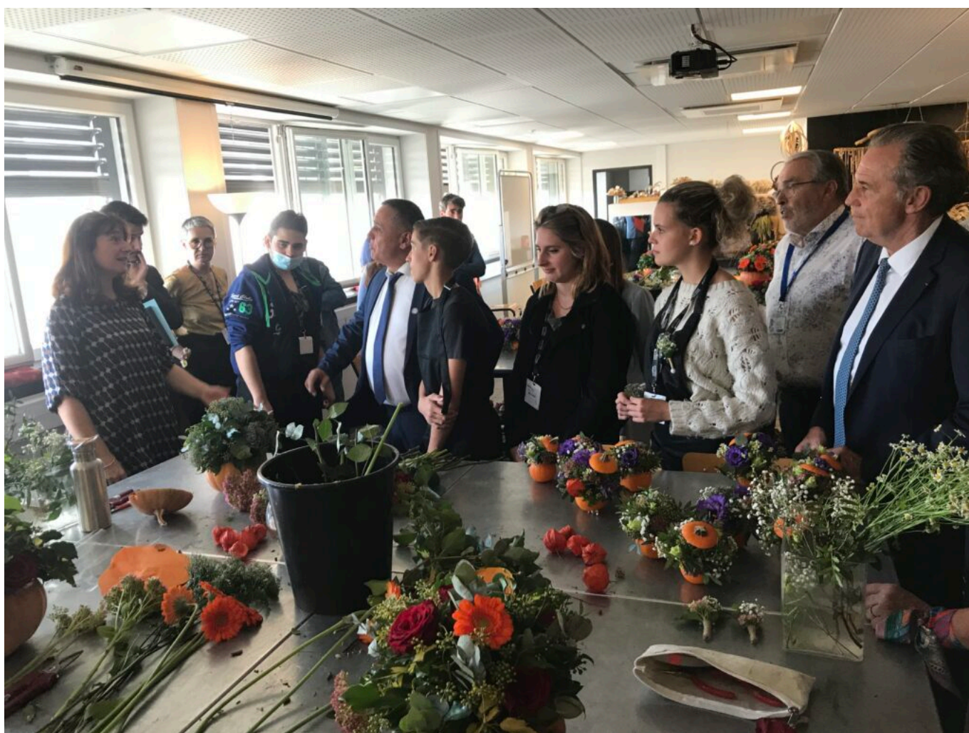
Rencontre avec les élèves et les professeurs du Campus avignonnais.