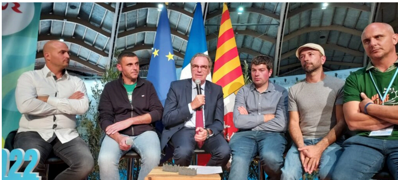
Renaud Muselier, président du Conseil régional de Provence-Alpes-Côte d'Azur, avec les représentants des éleveurs de toute la région Sud, lors du salon Med'Agri qui vient de se tenir à Avignon

Il ajoute : « Il faut remonter à 4 000 ans dans le passé pour retrouver les premières traces de pastoralisme en Région Sud. Plus qu'une tradition, c'est un héritage, un savoir-faire ancestral qui perdure grâce à la passion des bergers. Leur amour des bêtes, de la nature, leur don de soi, un métier d'une rare noblesse qui mérite un soutien sans faille. Nous serons toujours à leurs côtés ».