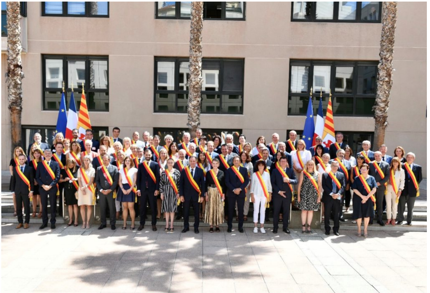
L'ensemble des conseillers régionaux.

A plus long terme, le plan climat est réaffirmé autour de deux objectifs principaux : être la première région 'neutre en carbone' et autonome pour la gestion des déchets en 2030.