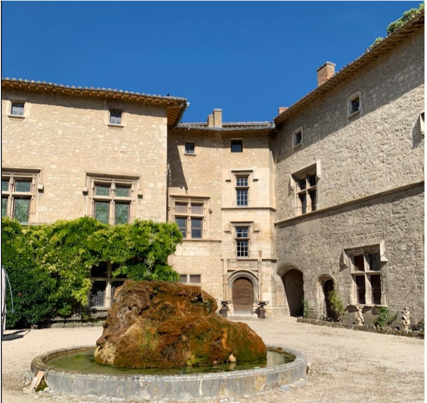
Une autre fontaine rocaille à l'entrée du château