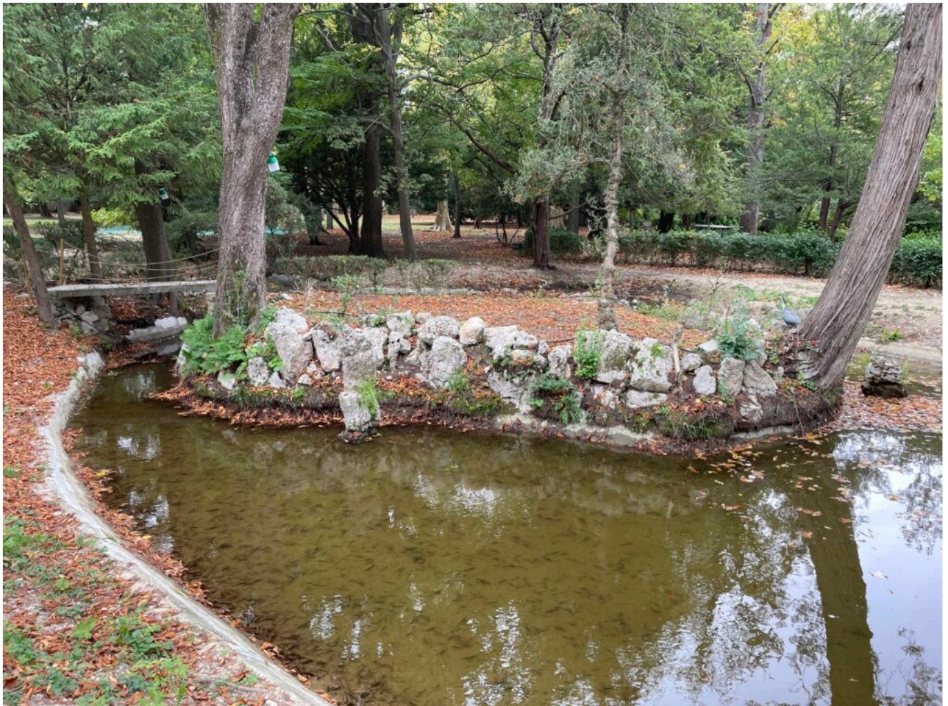
La rivière anglaise conçue à la Belle époque