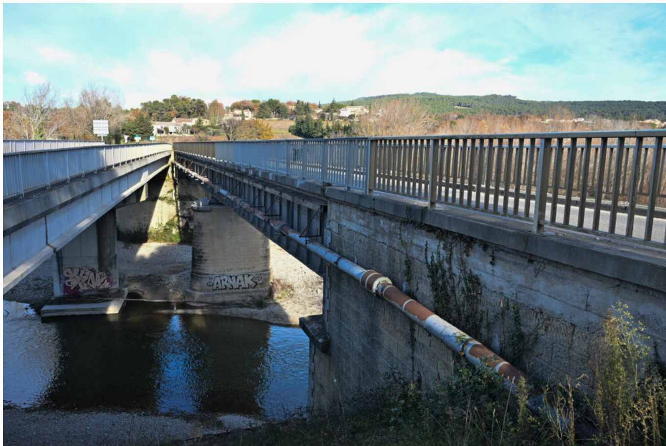
Le pont Valentin (à gauche) et le pont qui va être destiné à la véloroute (à droite).