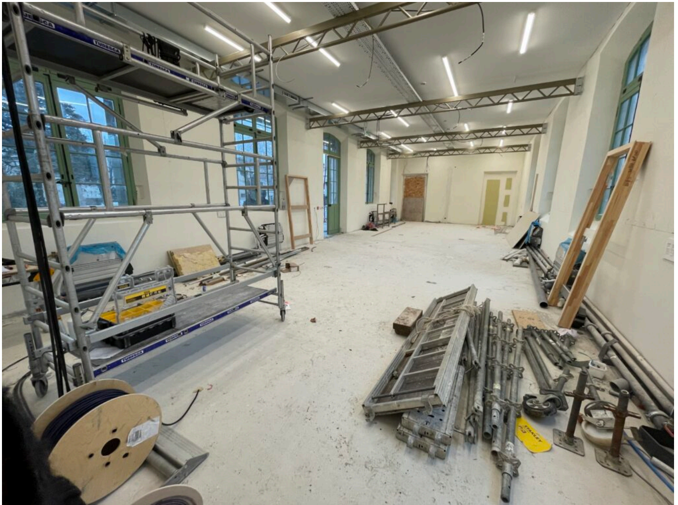
Une des quatre galeries de 110m2 en cours de finition