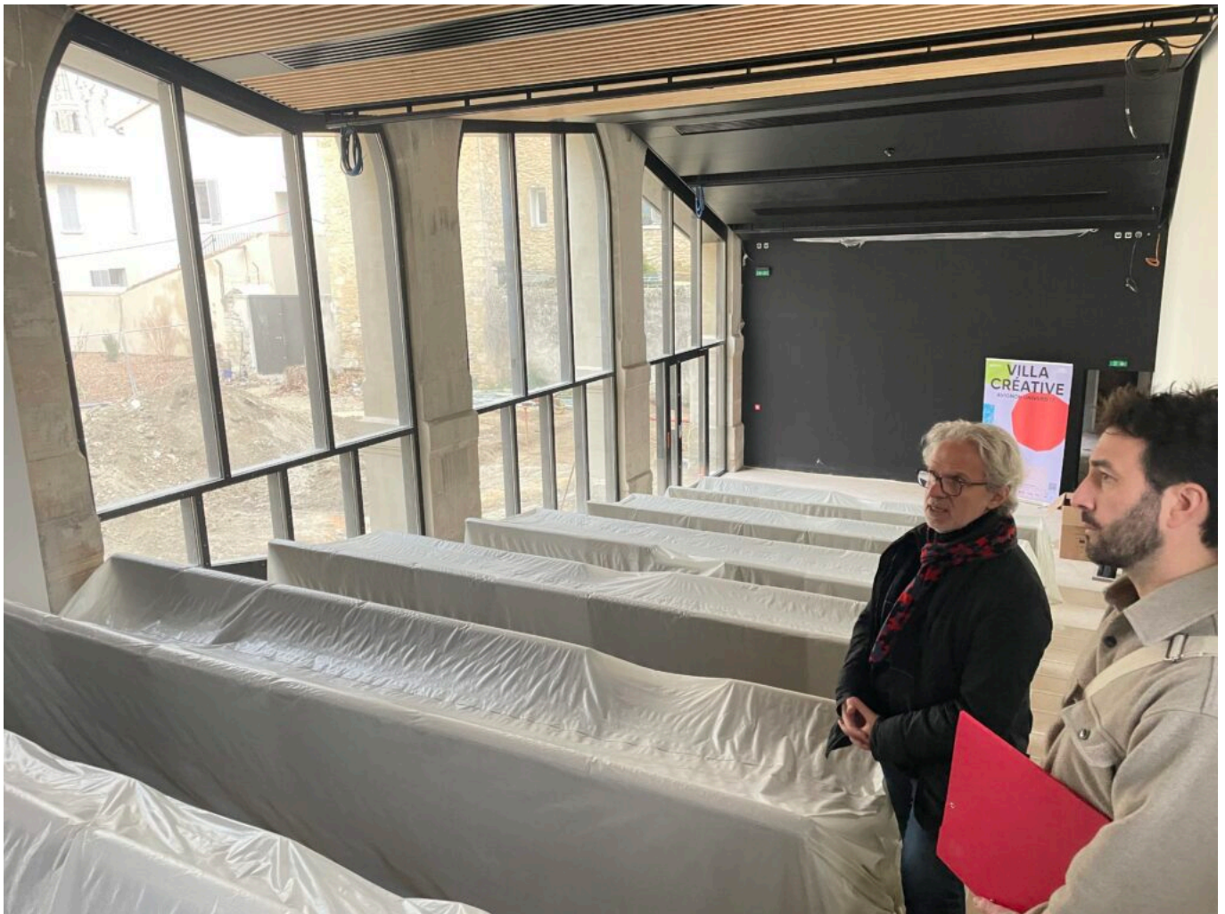
L'auditorium présenté par l'architecte Alfonso Femia et DLLA Architectes Copyright MMH

de la Recherche, de la Banque des territoires, de la Banque Populaire Méditerranée et de la SAS Villa Immo SUR, pour obtenir un budget de 18,9M€ nécessaire à la dépollution et la réhabilitation complète du site. En plus de l'édifice patrimonial, l'Université d'Avignon a choisi d'intégrer un deuxième site. Rénové à hauteur de 700 000€ avec le soutien du programme France Relance, ce bâtiment est situé à 300 m du site principal. Inauguré en juillet 2023, le Pavillon des Arts et Métiers est désormais le lieu d'implantation du Cnam -Conservatoire des arts et métiers- en Vaucluse.