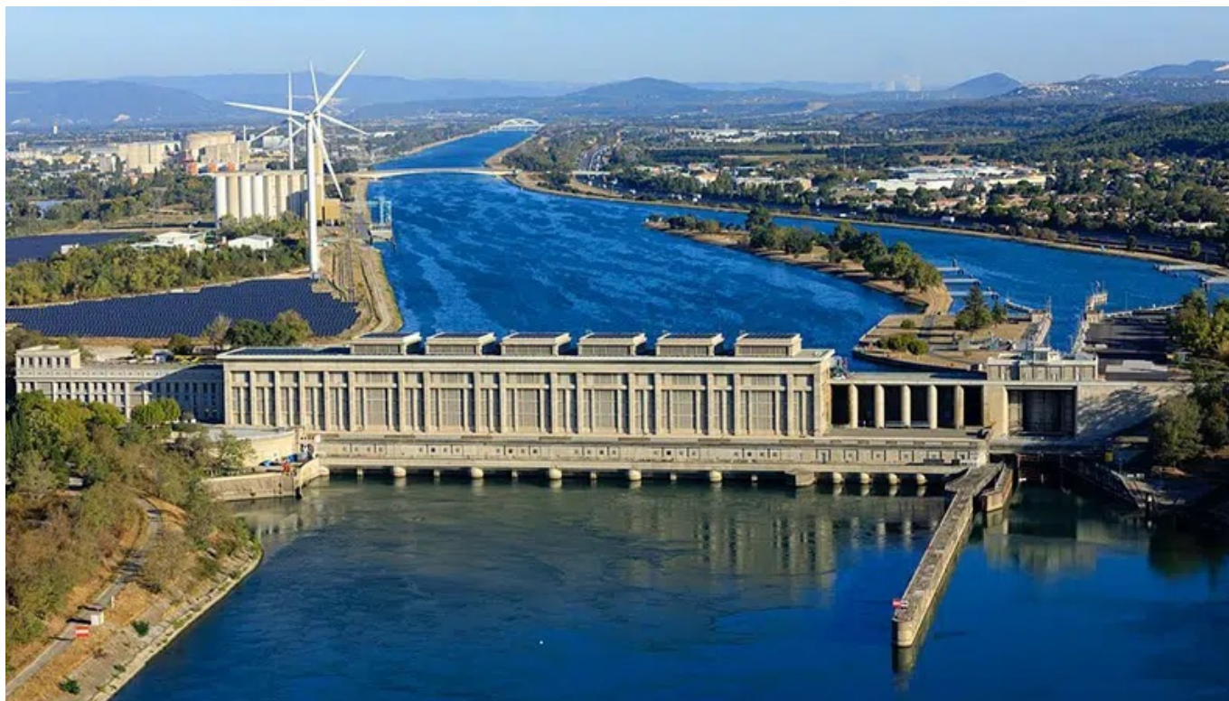
Centrale hydroélectrique de Bollène .

photovoltaïque 11% (source : Enedis). Le plus gros site de production d'électricité hydraulique est installé au niveau de la commune de Bollène, sur un canal parallèle au Rhône (barrage de Donzère-Montdragon). Il a été inauguré par Vincent Auriol en 1952, c'est-à-dire une éternité ! Il a fallu attendre 2019 pour qu'un autre projet d'envergure utilisant des énergies renouvelables soit mis en œuvre. Il s'agit de la centrale photovoltaïque flottante de Piolenc, avec ses 47 000 panneaux (soit 22 hectares), elle fût un temps la plus grande d'Europe.