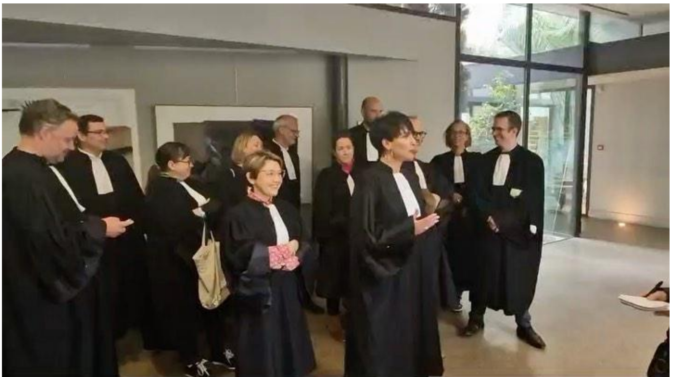
Les représentants des barreaux du ressort de la cour de Nîmes s'opposent à la réforme 'legal