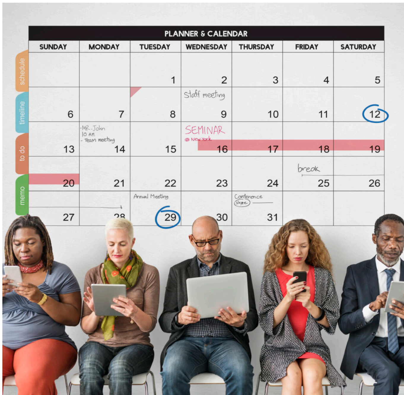
Calendar Planner Organization Management Remind Concept