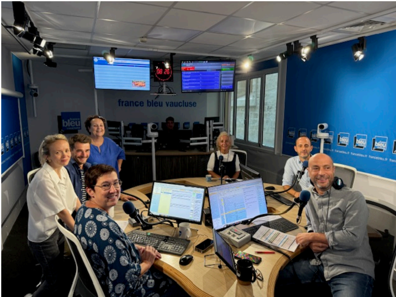
L'équipe des matinales de France bleu Vaucluse.