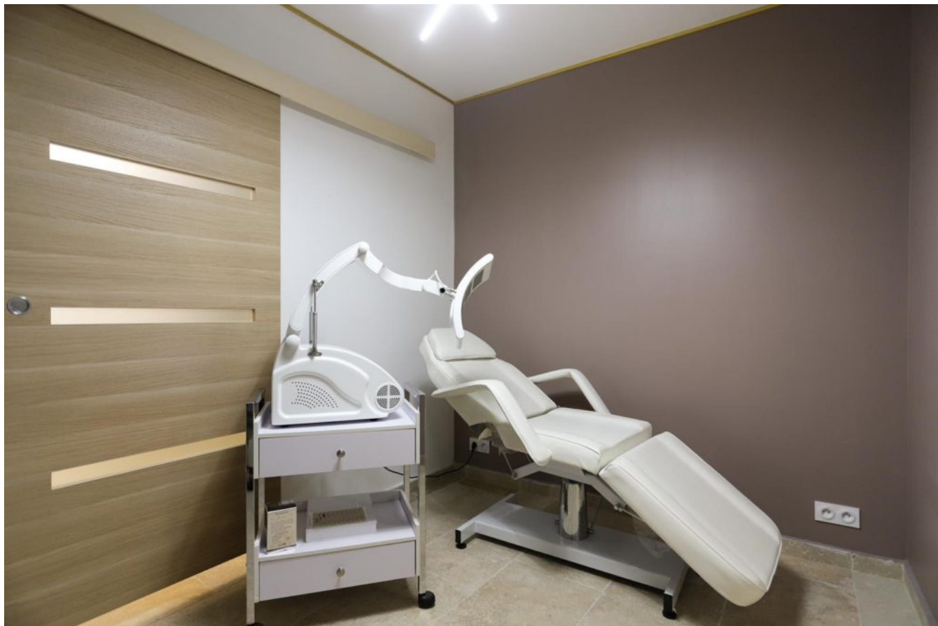
Espace de lumineothérapie.

pour une meilleure élasticité des tissus. Il permet également de traiter l'acné inflammatoire en rééquilibrant le sébum.