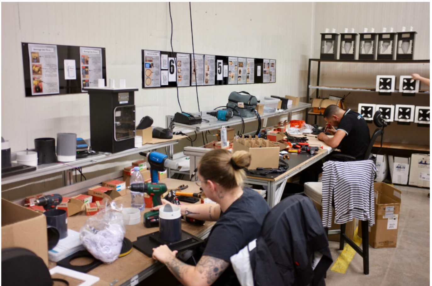
l'atelier d'assemblage