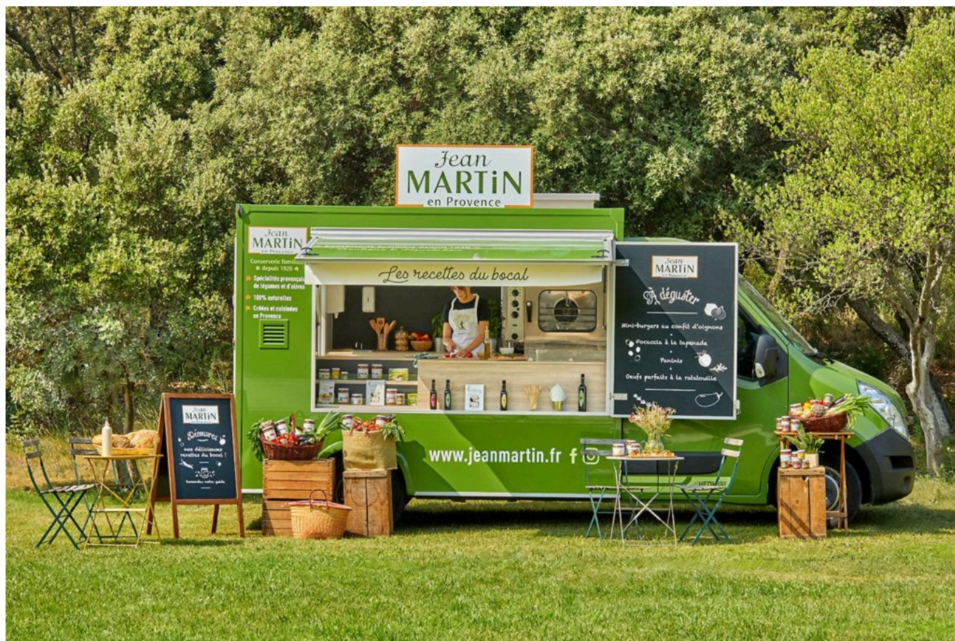
Food truck Jean-Martin

Informations pratiques : du jeudi 18 au lundi 22 novembre, de 10h à 20h, nocturne le vendredi jusqu'à 23h. Palais des congrès d'Arles : avenue 1ère division France Libre. Entrée : 8 euros, gratuit pour les moins de 12 ans, prévente tarif réduit jusqu'au 15 novembre inclus. Demi-tarif pour les enfants de 12 à 18 ans.