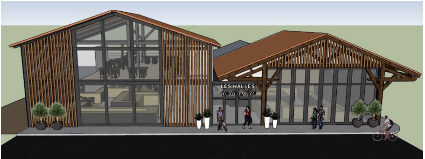
Maquette digitale de la devanture des Halles de la Gare.