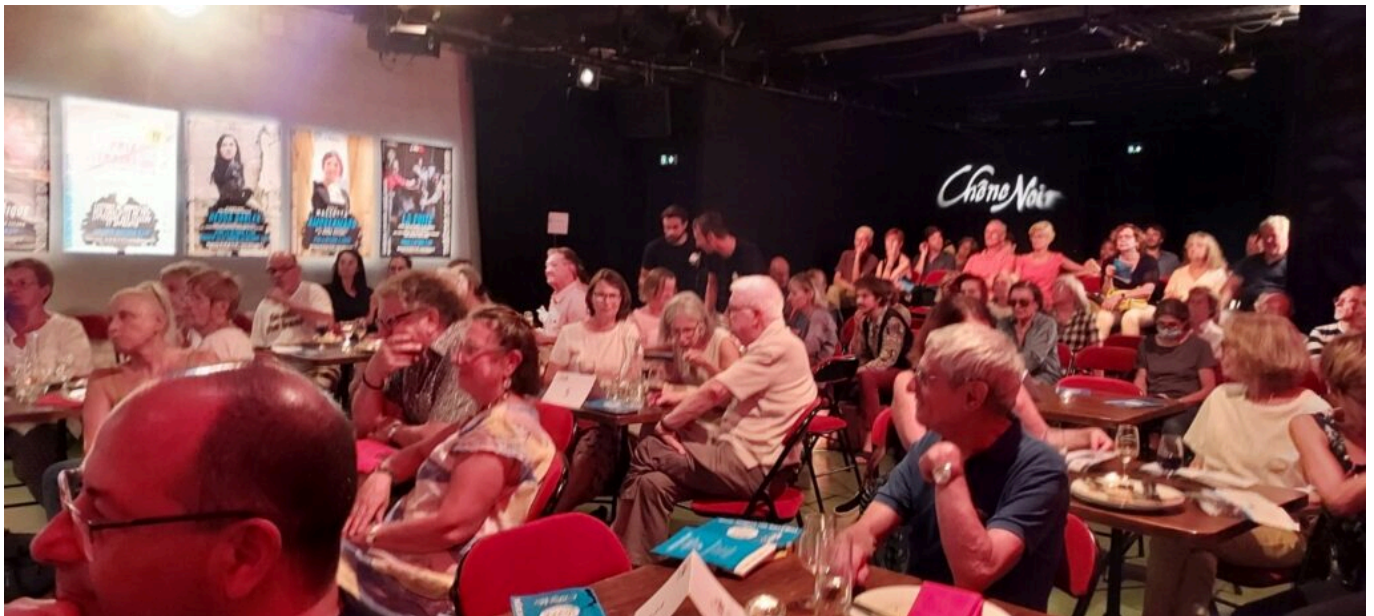
Le public lors de la présentation.