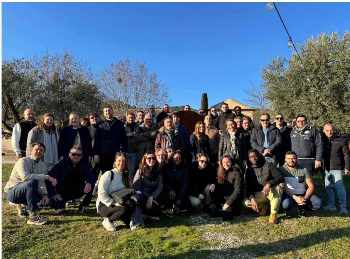
L'équipe Proespace groupe

«Nous devons l'accroissement de notre chiffre d'affaires à une stratégie de développement géographique et de marchés de spécialités. Aujourd'hui nous sommes dans une logique de stabilisation du chiffre d'affaires puisque nous avons renforcé notre bureau d'études et nos équipes de vente. Il y a donc ce temps de digestion avant de croître à nouveau.»