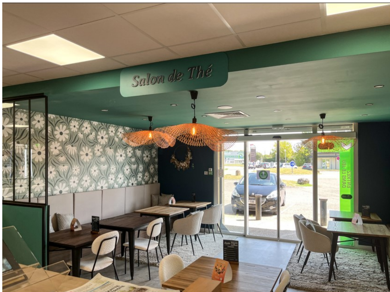
Conception d'un espace tabac-presse- salon de thé.