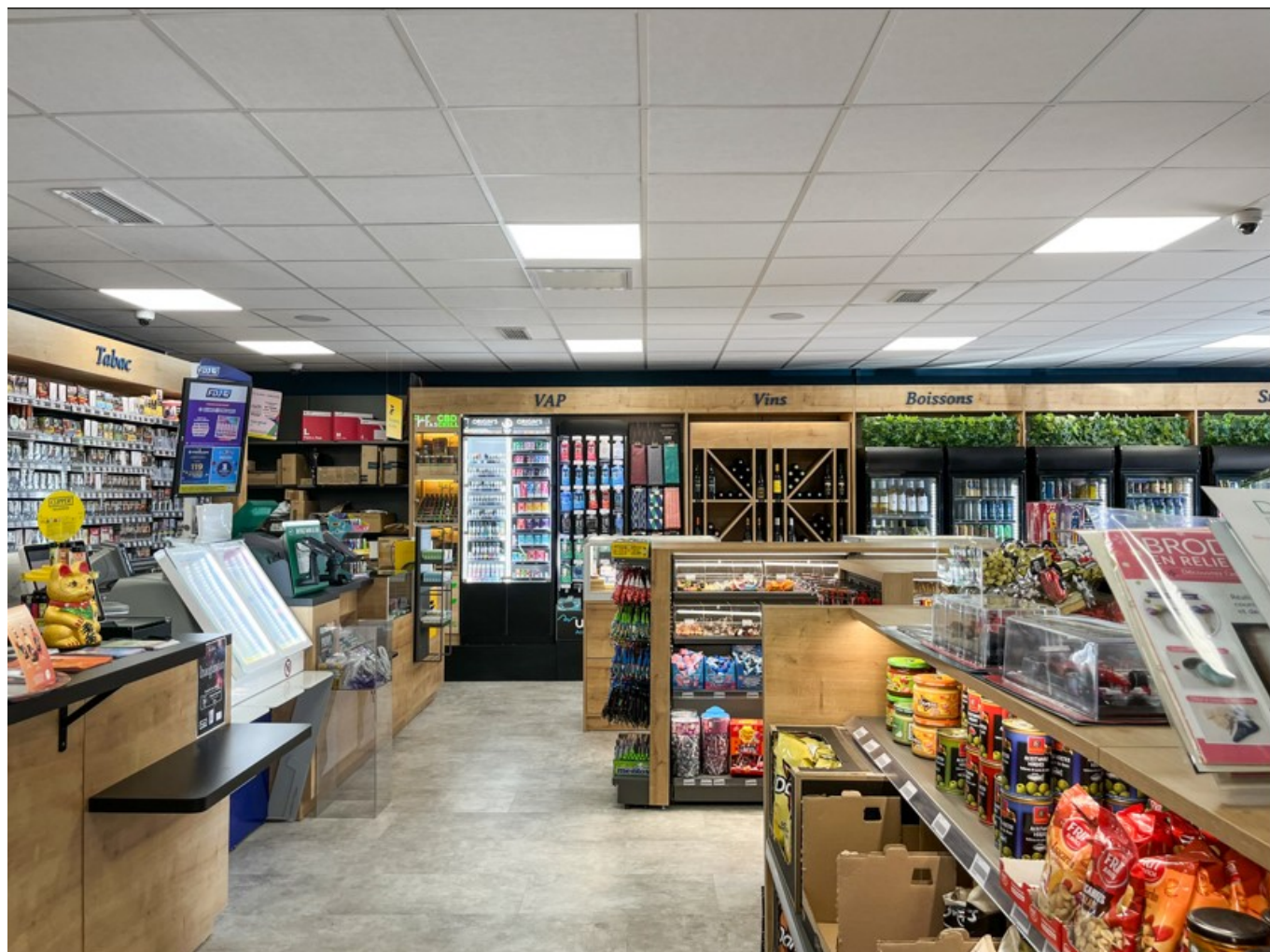
Conception d'un tabac presse

«Ce sont des agenciers de pharmacie plutôt régionaux ou nationaux. Il y a également des menuisiers mais qui ne sont pas, dans ce cas, des spécialistes. Le marché de l'agencement est surtout devenu de plus en plus complexe avec l'implantation de robots qui optimisent le stockage et réalisent la distribution automatique des médicaments et dont il faut tenir compte dans l'agencement et les contraintes réglementaires et les engagements de l'État. En étant spécialistes, nous apportons une écoute et une pertinence à nos clients, nous nous adaptons et nous apportons des solutions aux spécificités du marché, actuelles et également tendancielle.»