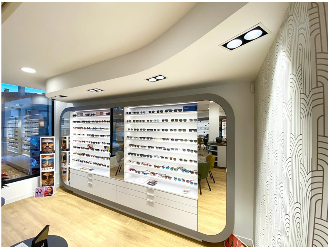
Conception d'un magasin d'optique.