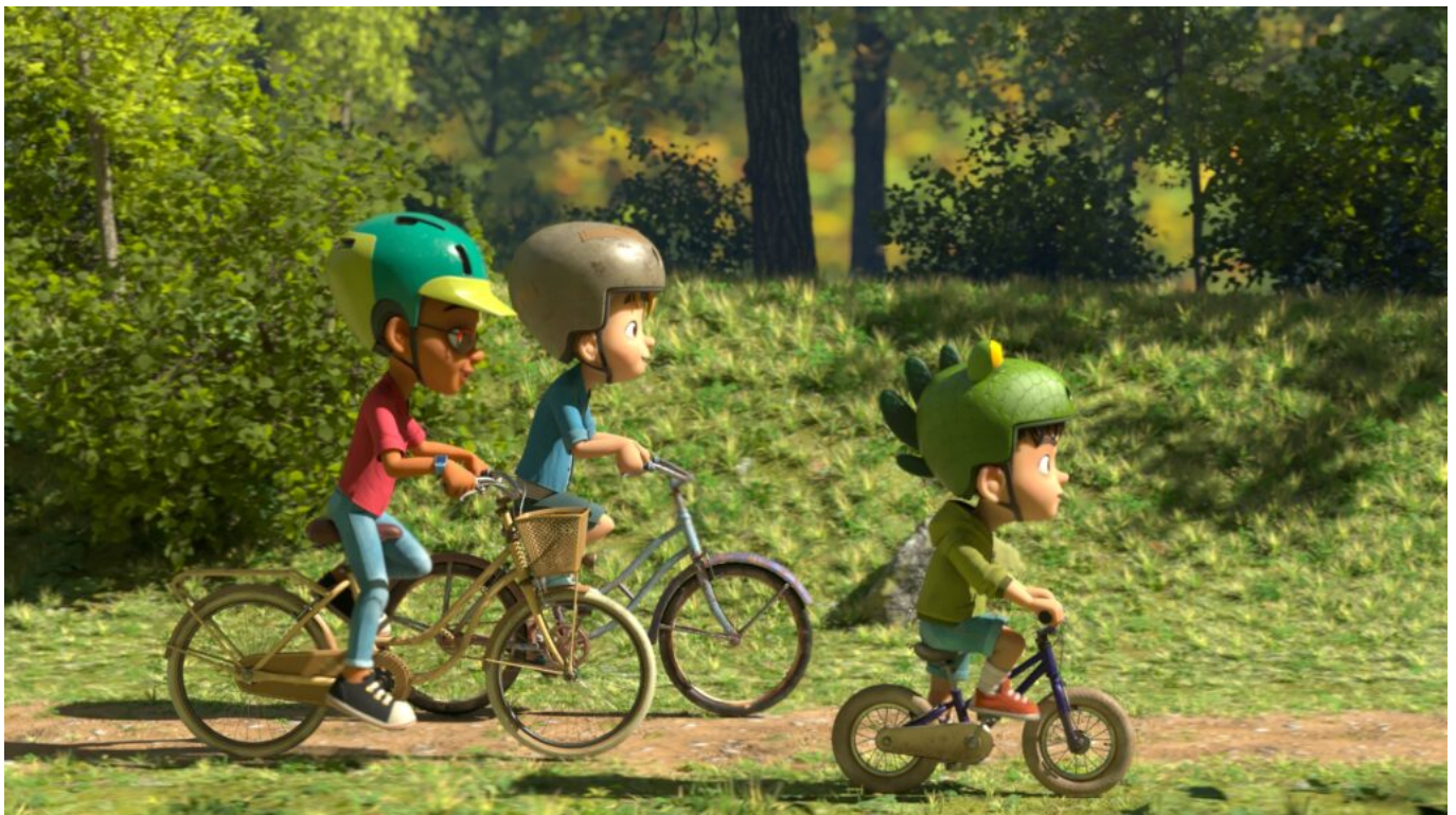
Partie de Campagne

Plus qu'un soutien, Loïc Etienne accompagnera le studio Station animation dans toutes les démarches jusqu'au choix des locaux. Installé dans des locaux de 150 mètres carré au cœur du centre-ville, la société dispose de tous les aménagements pour accueillir la quinzaine de modeleurs, 'textureurs' et quelques 'setupeurs' qui travaillent au quotidien pour le studio.