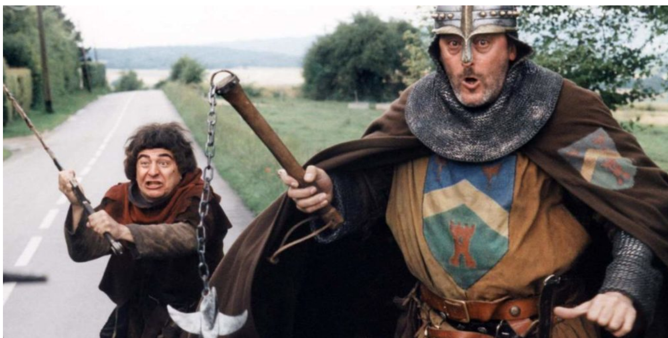
Christian Clavier et Jean Reno, ‘Les visiteurs’.