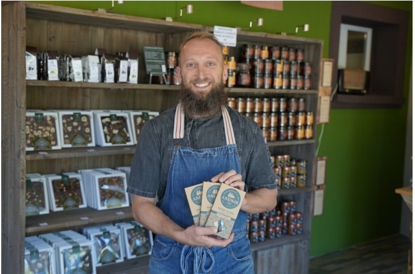
Marc Chaloin © CMAR

ses effectifs en 3 ans, passant de 3 à 6 et les fait travailler 30h par semaine : « Comme ça, ils sont en forme, frais et dispos ». Le bien-être au travail fait partie de son crédo d'entrepreneur engagé ».