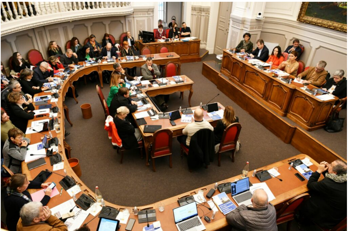
Les conseillers départementaux attentifs à la parole de la représentante de l'Etat en Vaucluse

La préfète continue de détailler sa feuille de route : pour l'éducation, il faut accélérer les efforts, dédoubler les effectifs dans les REP (Réseaux d'éducation prioritaire), pas plus de 24 élèves par classe et aussi offrir une scolarisation inclusive aux enfants handicapés, à ce jour le but de 90 unités d'inclusion est quasiment atteint. Pour lutter contre les déserts médicaux, les structures de soins doivent être démultipliées. Il existe 24 maisons de santé, dans le cadre du Covid, 20 centres de vaccination et de dépistage ont été mis en œuvre.