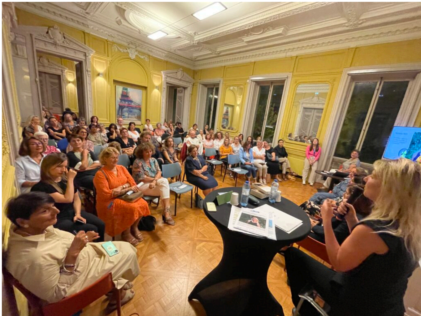
Les parcours inspirants de femmes leaders