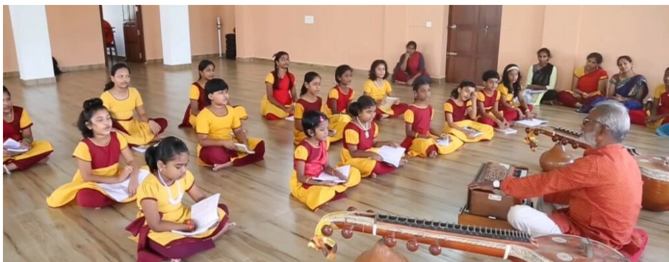
Leçon de chant