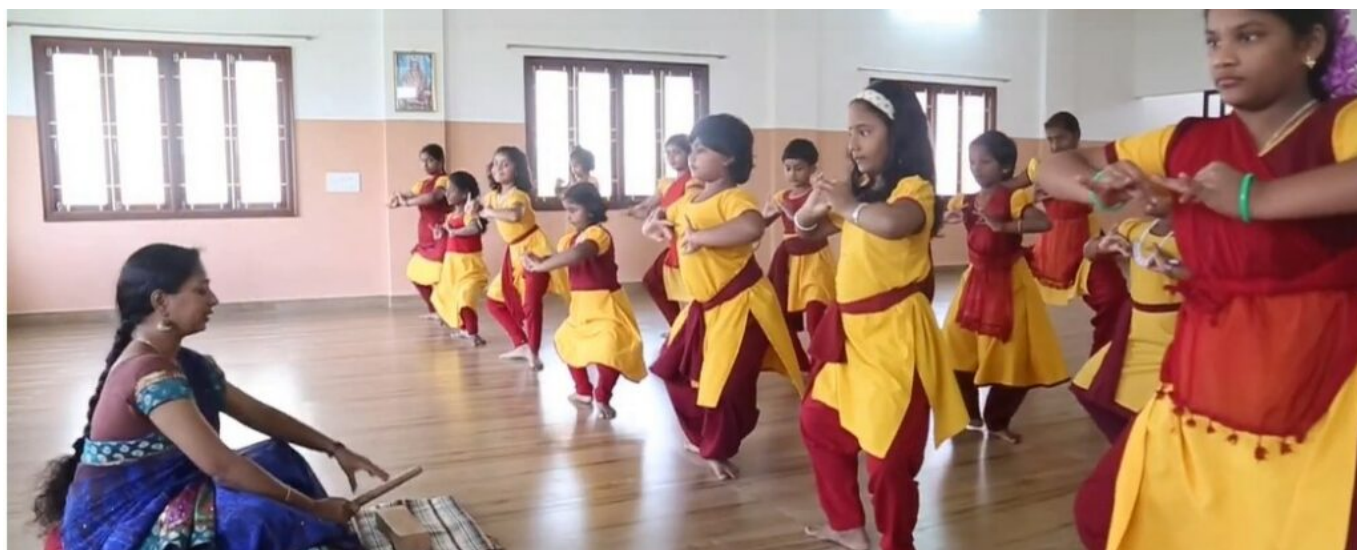
Leçon de danse